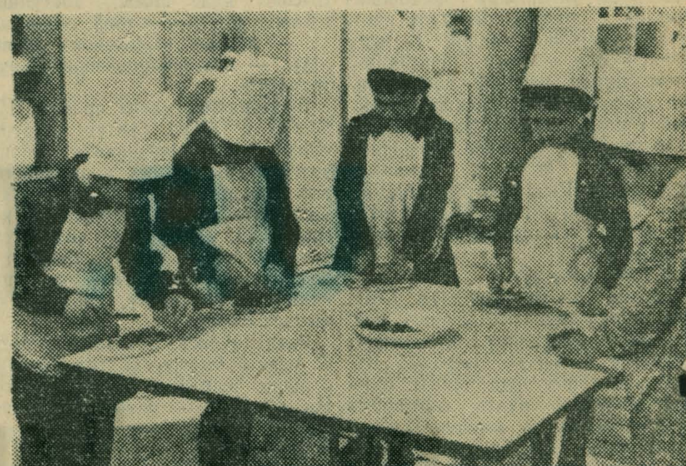
Девочки, которых вы видите на снимке, — воспитанницы детского сада № 50 совхоза имени Моссовета. В детском саду они получают разнообразные навыки домашнего труда. Юные кулинары занимаются разделкой овощей.