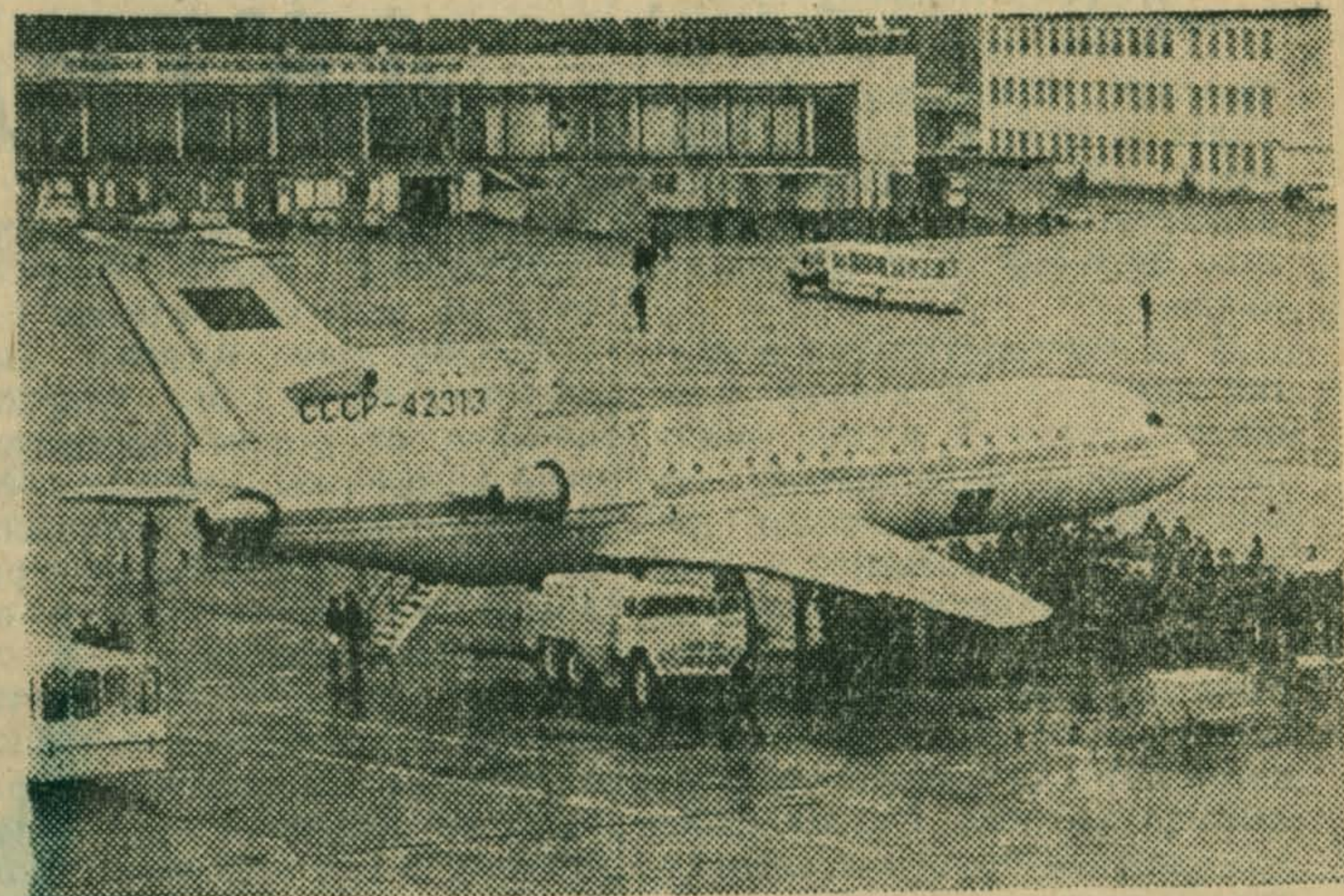
Недавно на трассах Аэрофлота начал летать новый 120-местный пассажирский самолет «ЯК-42» (на снимке). Он предназначен для полетов по редким магистральным и местным авиалиниям, оснащен бортовым навигационным комплексом и цифровой вычислительной машиной, которые помогают пилотам вести полет в сложных метеорологических условиях.