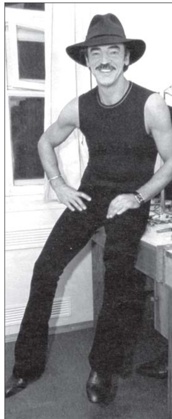
Баллоном, и шпага от Валентина Смирнитского.