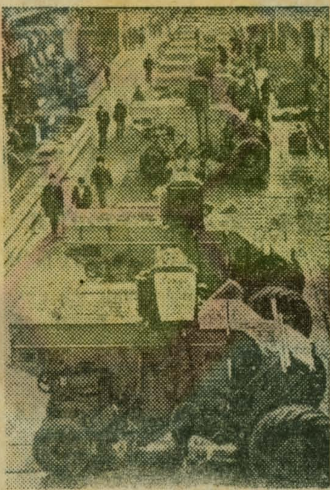
В горячие дни уборки хлебов на поля нашей страны, многих социалистических и развивающихся

ся стран выходят комбайны «Нива». Эту высокопроизводительную машину выпускает завод «Ростсельмаш», расположенный в Ростове-на-Дону.