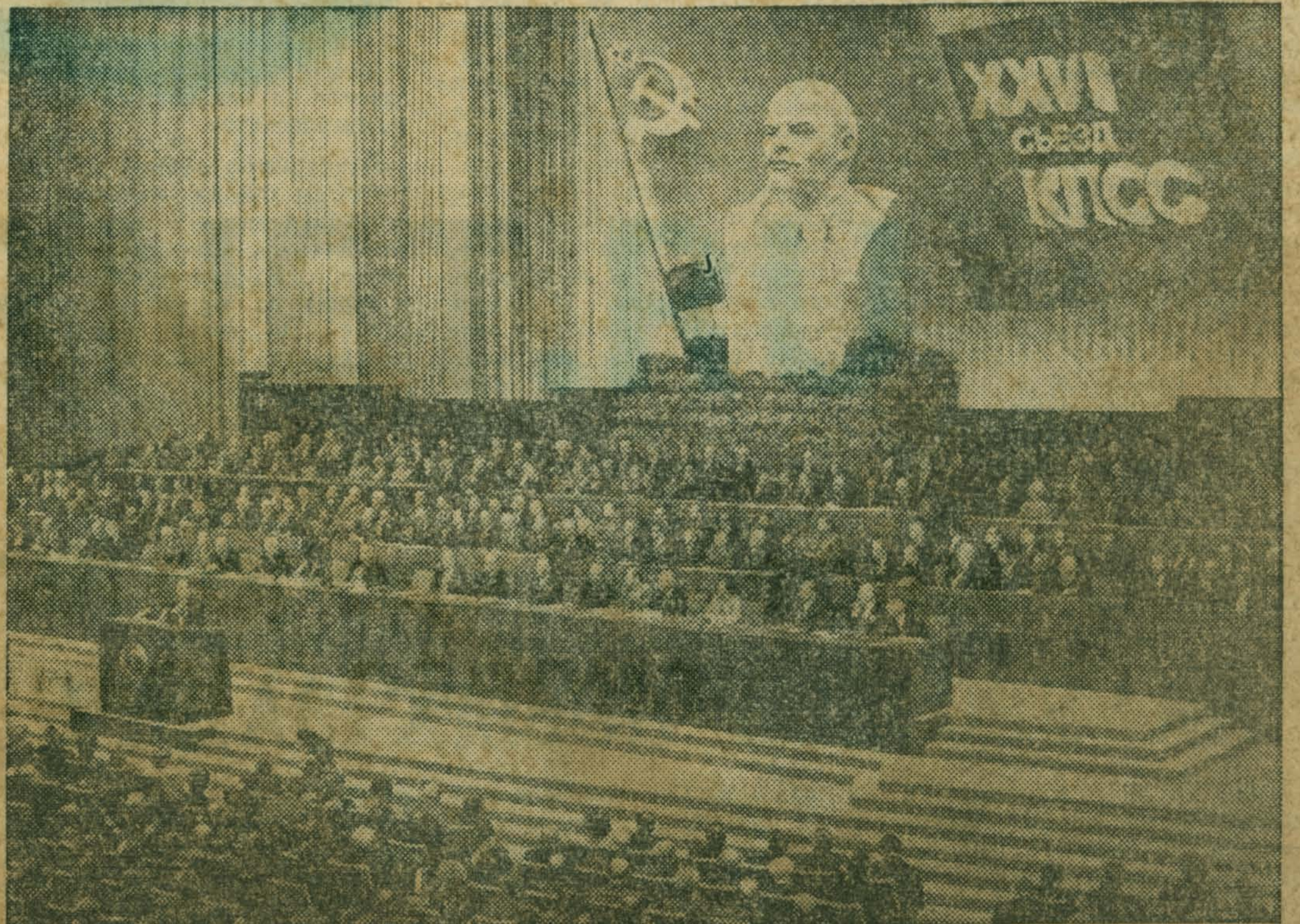
Москва. Кремлевский Дворец съездов. На XXVI съезде КПСС.

На утреннем заседании 27 февраля делегаты перешли к рассмотрению следующего вопроса порядка дня съезда. С докладом «Основные направления экономического и социального развития СССР на 1981—1985 годы и на период до 1990 года» выступил Председатель Совета Министров СССР Н. А. Тихонов.