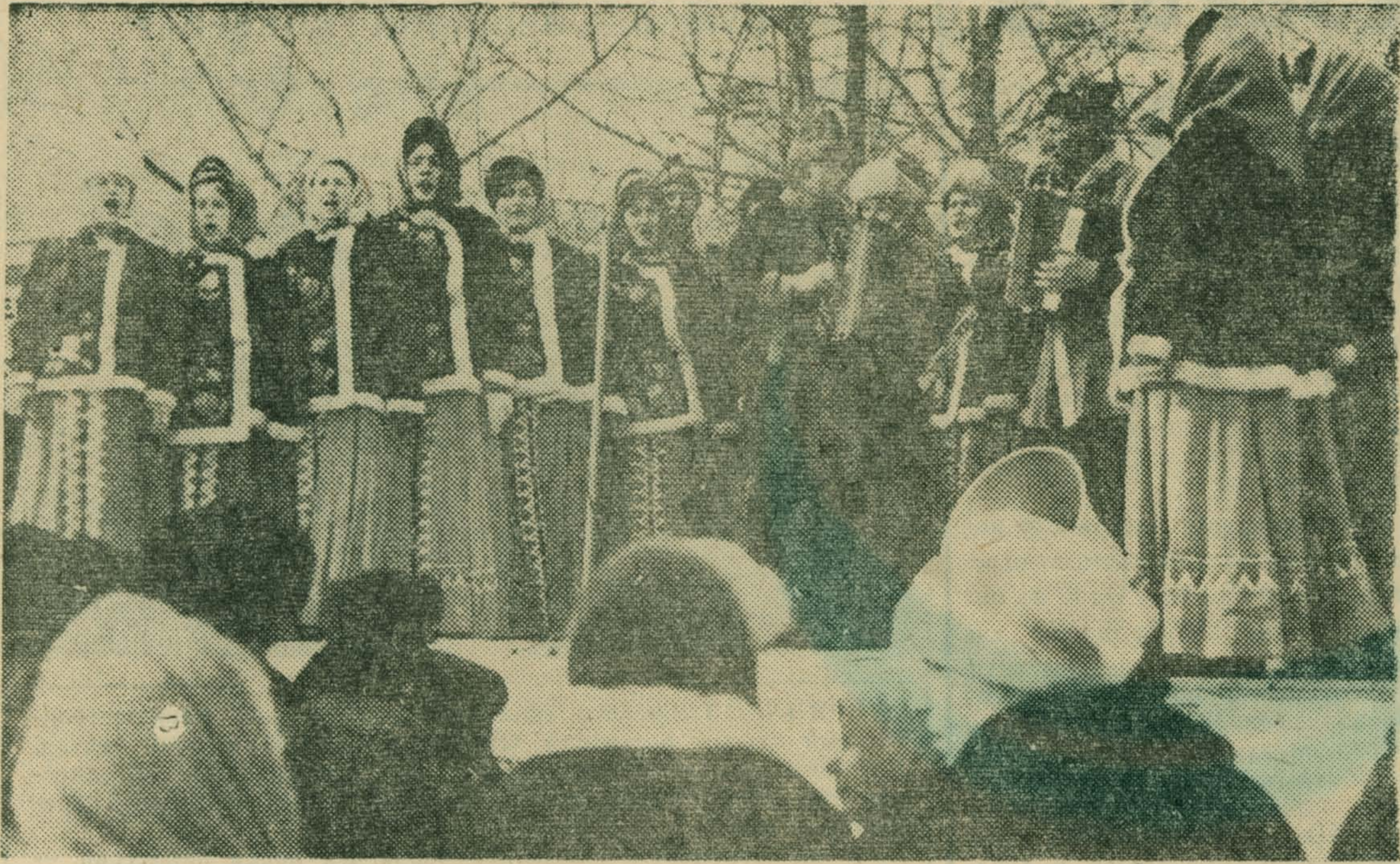
Весело провожали зиму жители района. Наш фотокорреспондент О. Грицев побывал на празднике «Люберецкая весна» и сделал там этот снимок.