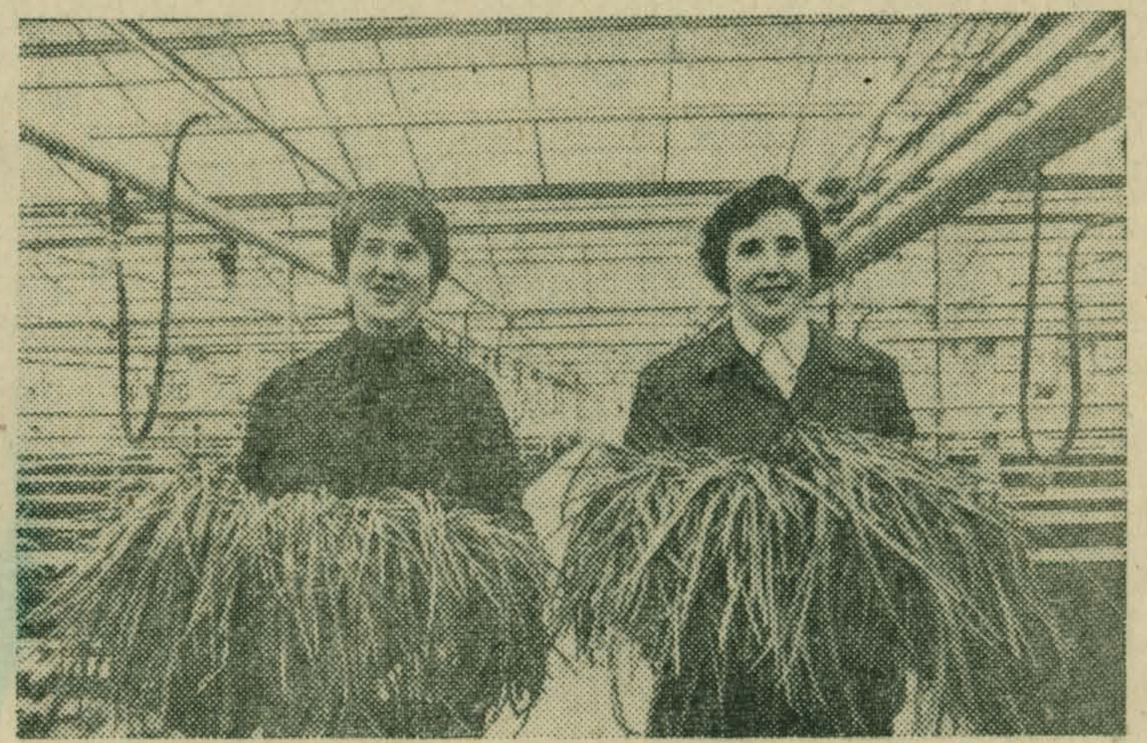
БРЯНСК. Труженики объединения «Брянский машиностроительный завод» построили теплицы площадью в один гектар. Предполагается, что они будут давать для столовых объединения 140 тонн огурцов, помидоров, лука и другой зеленой продукции в год.

В многотысячном коллективе появилась новая профессия — агроном.