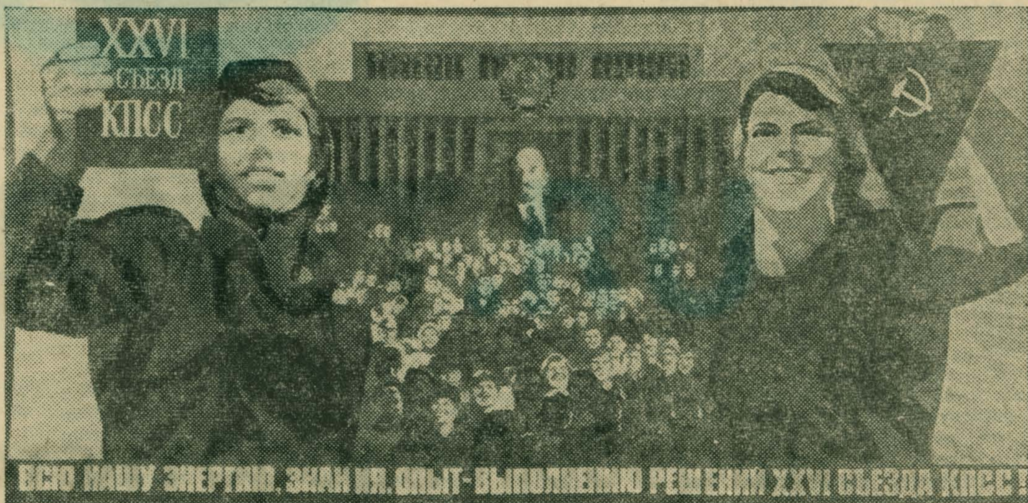
Плакат художника В. Кононова. Издательство «Плакат».

Техническому прогрессу в текущей пятилетке принадлежит особая роль. Партийные организации предприятий призваны всемерно способствовать его ускорению, направлять деятельность коллективов на претворение в жизнь решений партийного съезда.