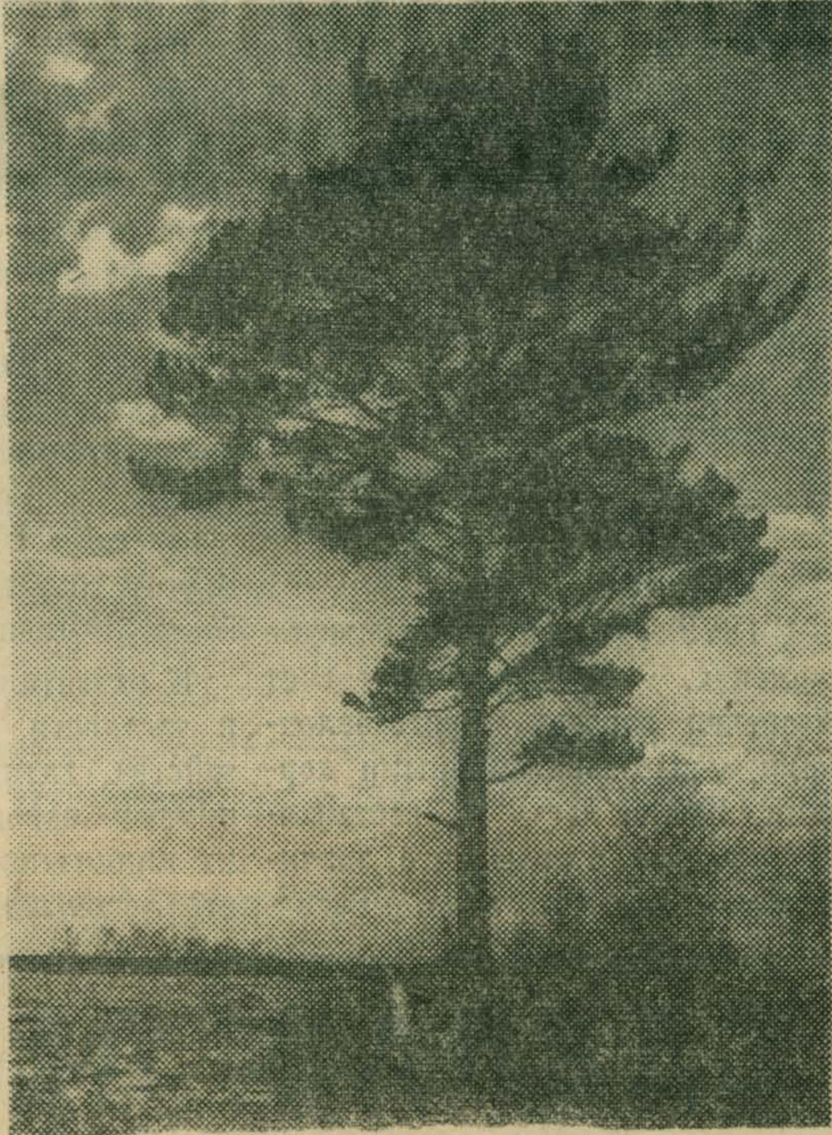
АПРЕЛЬСКИЙ РАССВЕТ. Фотоэтиюд О. КОРОВИНА.

Виктор МУСАТОВ На холоде, но слезы капали. в тени (ничего!) Не плакали они. Белый столб На еолнышке заплакали: В мороз над крышей Глаз нет. Поднимается все выше. (ищи!)