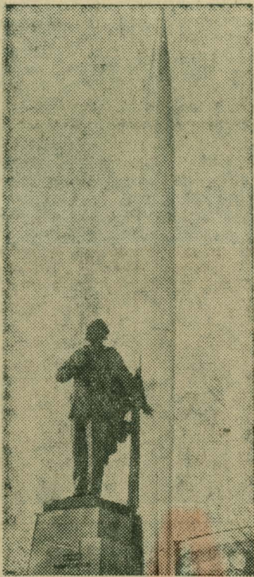
НА СНИМКЕ: памятник К. Э. Циолковскому на площади Мира в Калуге.

Н. ЖЕЛЕЗНОВ, спец. корр. ТАСС. Космодром Байконур—Москва.