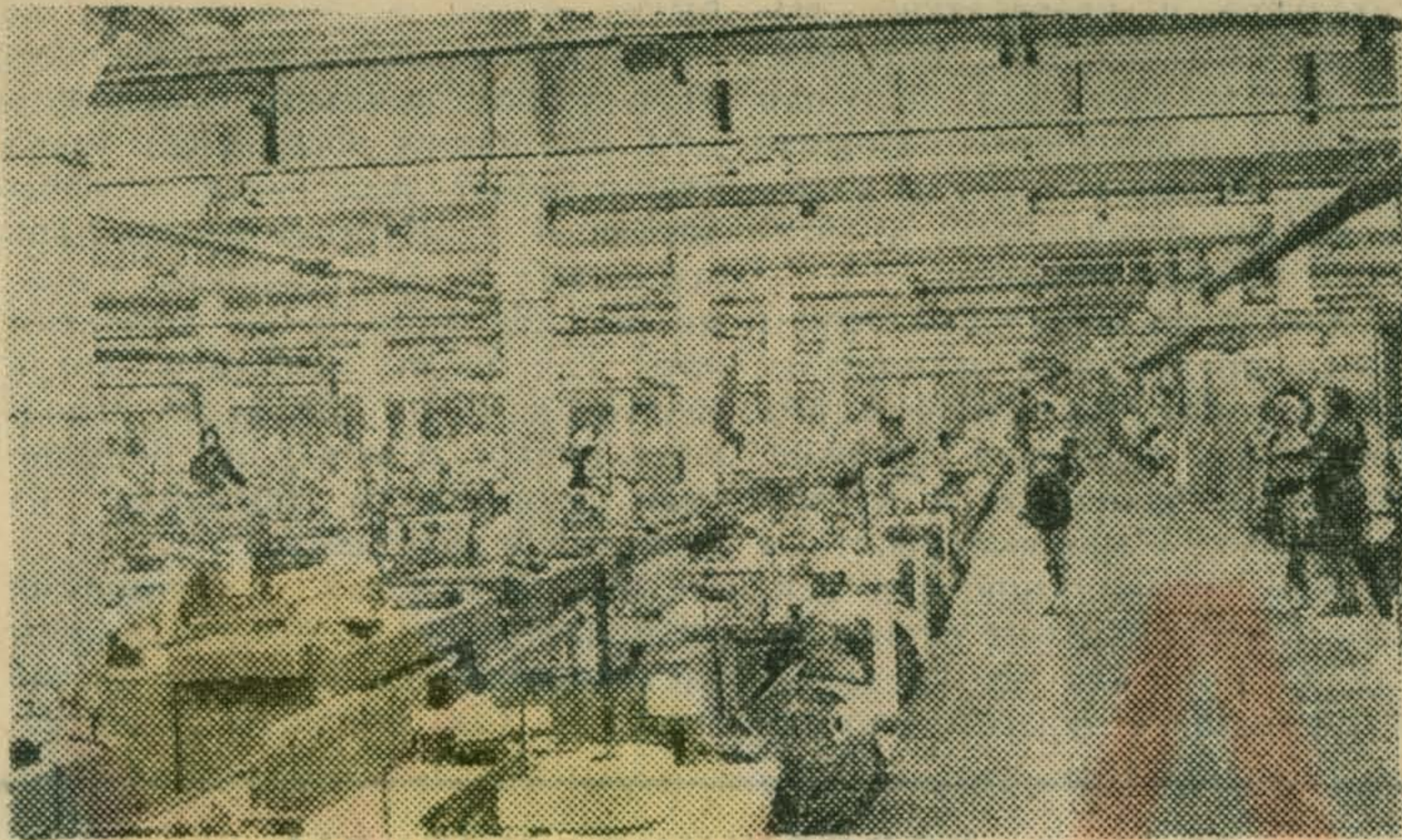
С большим подъемом прошел коммунистический субботник на фабрике имени Октябрьской революции. В нем приняли участие более двух тысяч человек.

Этот номер газеты люберецкие журналисты и полиграфисты выпустили в день коммунистического субботника.