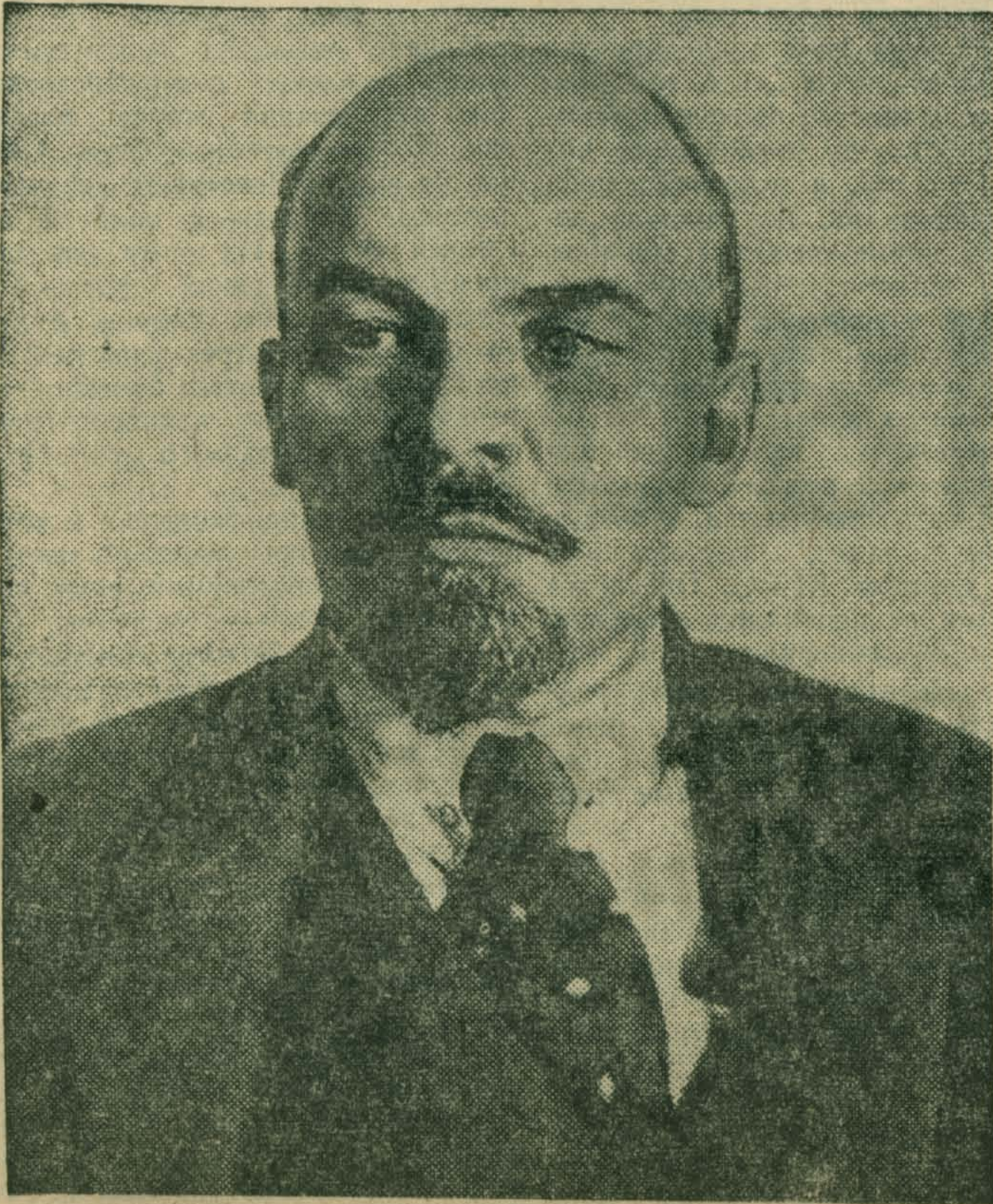
В. И. Ленин. Москва, октябрь 1918 года.

Пусть живет в веках имя и дело Владимира Ильича Ленина.