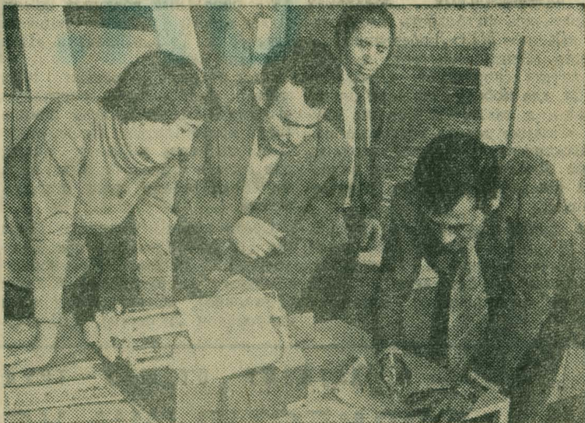
АРМЯНСКАЯ ССР. Первый в стране электронный центр коммутации телеграфных сообщений, оснащенный отечественными ЭВМ, принят в эксплуатацию на ереванском телеграфе Министерства связи Армянской ССР.

Центр обеспечивает взаимодействие между собой нескольких сотен конечных пунктов. Теперь телеграмма из отделения связи любого пункта поступает в ЭВМ. Компьютер принимает ее, распределяет телеграммы по срочности и устанавливает порядок отправления.