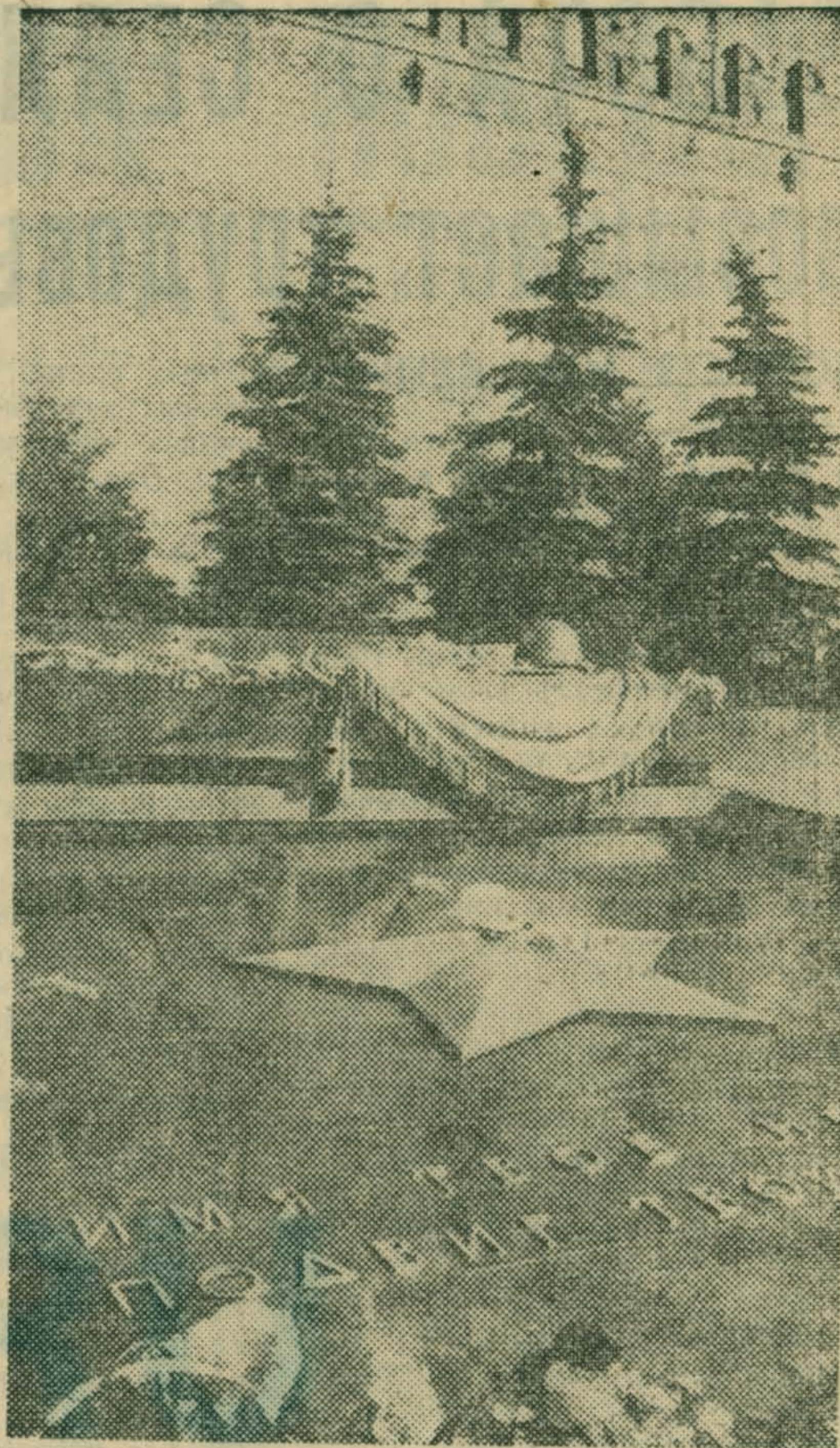
Москва. Вечный огонь Славы у могилы Неизвестного солдата.