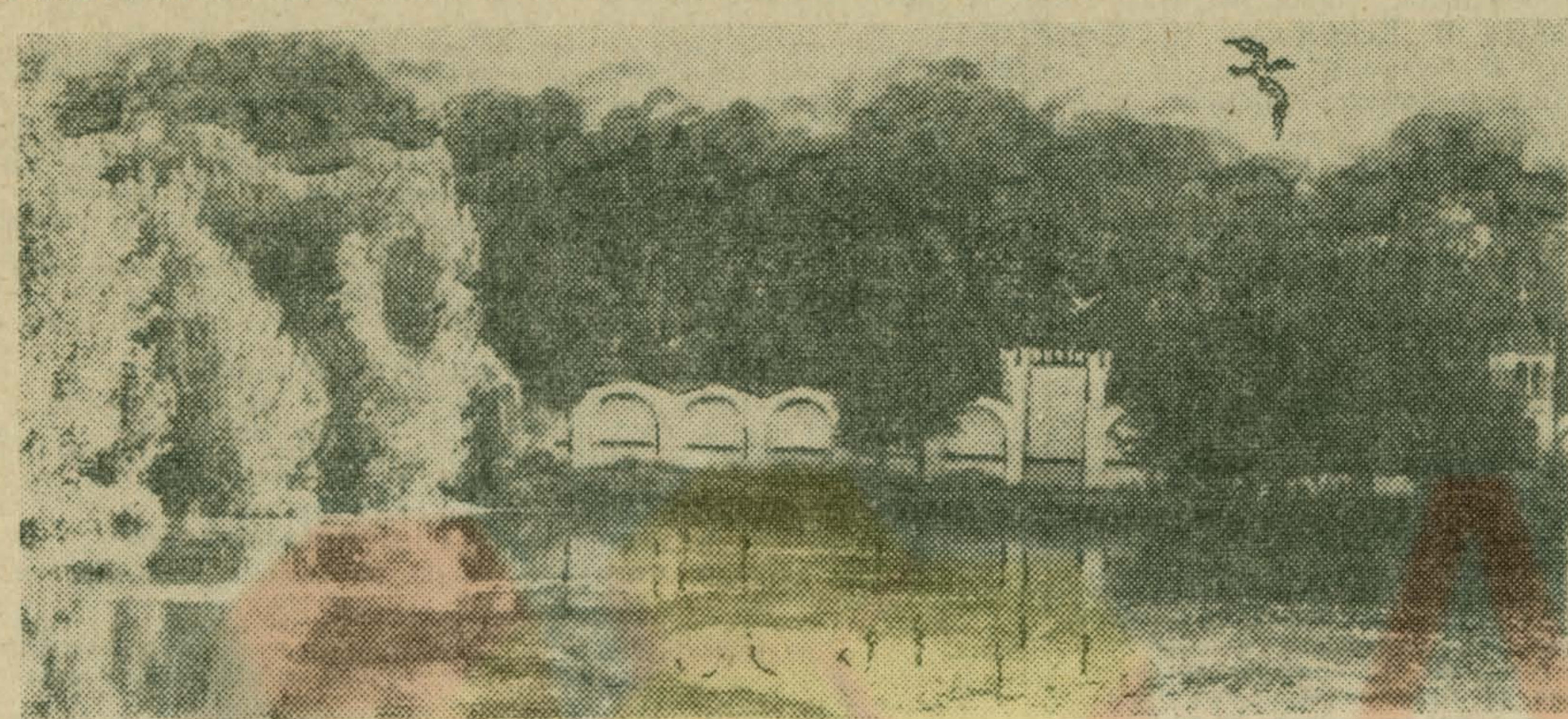
Город Дзержинский славится живописными уголках черпают вдохновение многие авторы, местами. И, несомненно, в таких поэтических создавая произведения о родном крае.

Брак продукции — материализация пьянов сознания. Критиковал не взирал на лица, но взирал на должности. Если зарыл талант в землю, не жди от него плодов. Статья доходов соответствовала статье уголовного кодекса. Природе приходится порой вести борьбу за свое существование. А. ИГЛОВ.