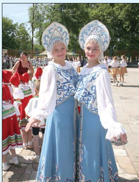
Неделя местной прессы завершилась! Об ее итогах читайте на стр. 2, 3, 4, 8, 9.