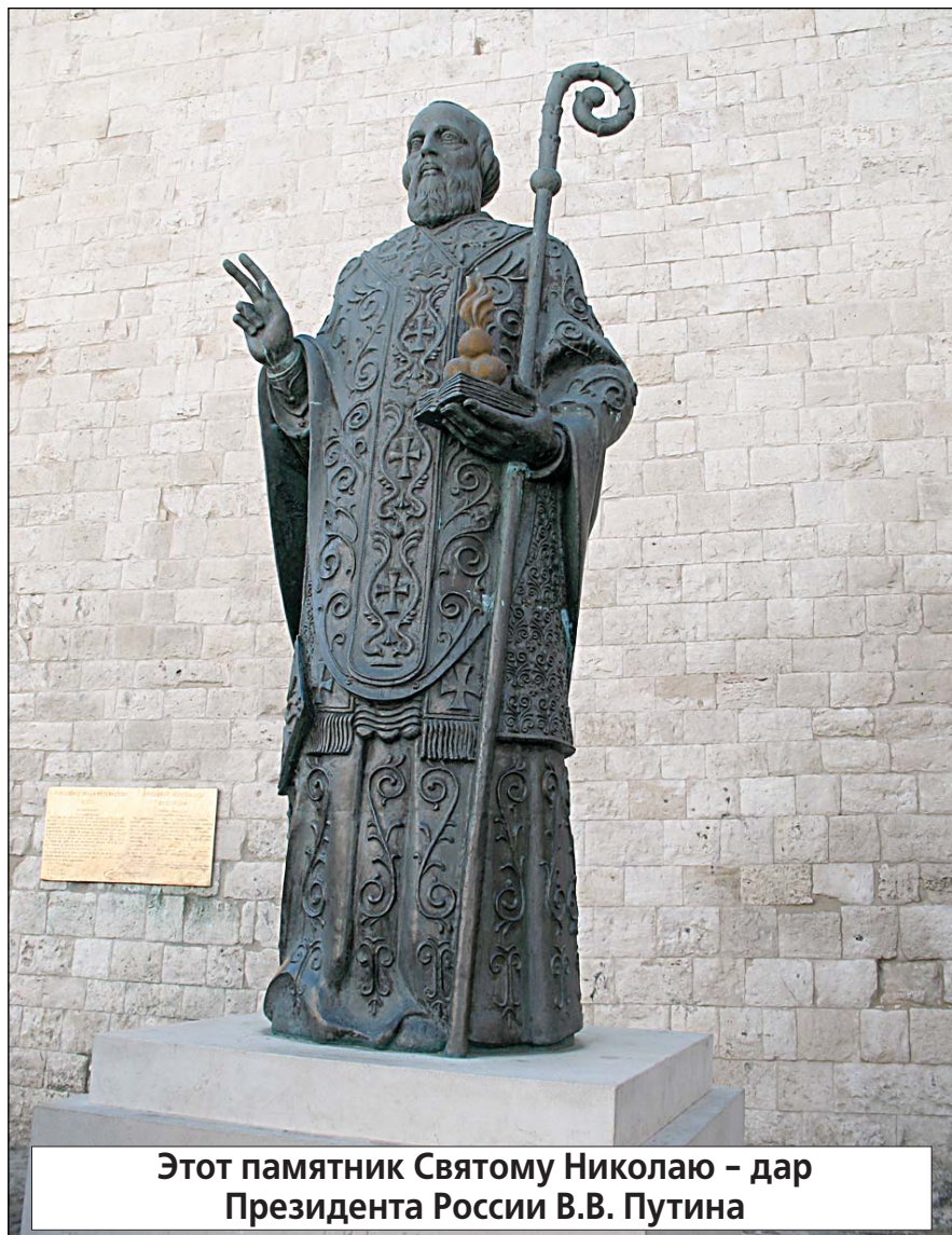
Этот памятник Святому Николаю - дар Президента России В.В. Путина

Подробный отчет - в ближайших номерах «ЛП».