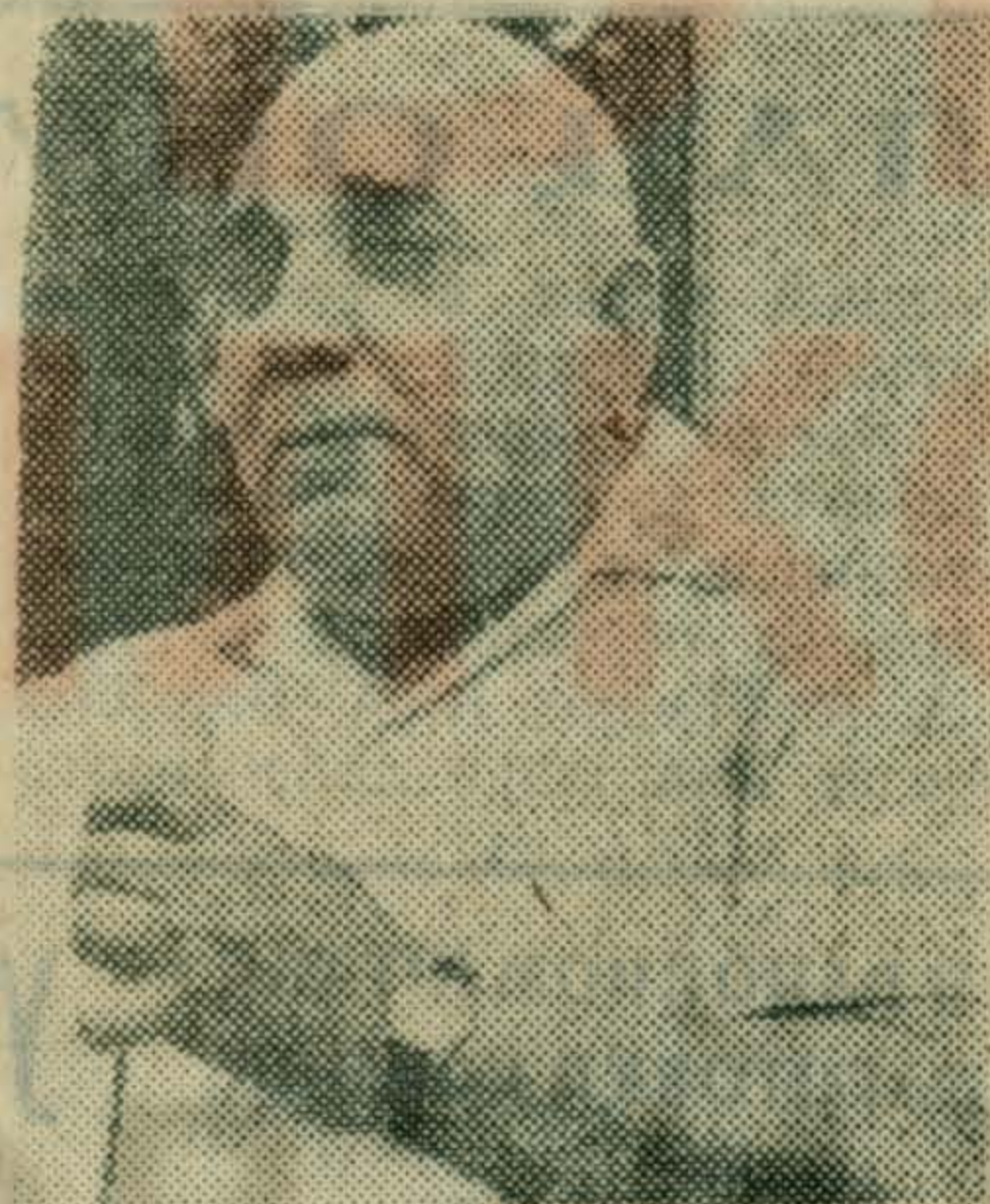
Оживленно бывает после трудового дня на летней агитплощадке.