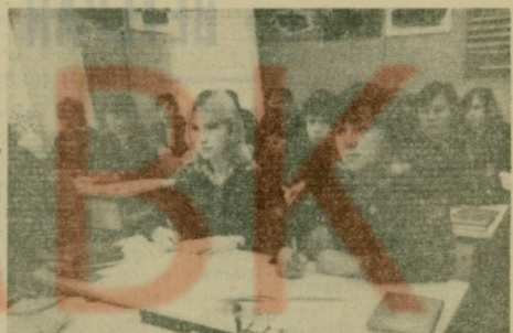
Программный материал гораздо легче усваивается учащимися в кабинетах, оборудованных с учетом требований научной организации труда.

Документы принимаются до 30 августа. НАЧАЛО ЗАНЯТИЙ 1 сентября.