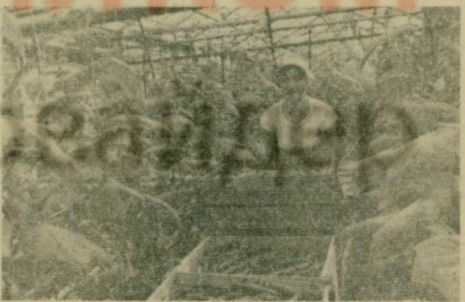
Профессионально-техническое училище, расположенное на территории совхоза «Марфино», имеет свою учебно-производственную базу. Здесь учащиеся получают навыки работы в теплицах, у квалифицированных растениеводов перенимают опыт получения высоких урожаев различных овощей.

АДРЕС УЧИЛИЩА: 127427, Москва, Кашенный луг, дом № 4, телефоны 218-16-77, 218-40-95.