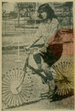
Выражение «изобрести велосипед» давно уже означает примерно то же, что и «открыть Америку», то есть придумать что-то давно уже придуманное. Но, видимо, и в велосипедном деле можно создать что-то принципиально новое. Очень наглядно продемонстрировано это новые велосипеды (на снимке), экспонированные на международной торговой ярмарке в Токио.