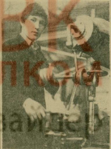
Мастерские училища, расположенные на территории базового предприятия — завода имени Ухтомского, оснащены современным оборудованием. Здесь есть токарный участок на 30 мест, слесарный — на 60 мест, фрезерное отделение, электромонтажная лаборатория. Неудивительно поэтому, что учащиеся в период прохождения производственной практики, со знанием дела трудятся и на таких станках, как радиально-сверлильный (см. снимок).

Для получения профессии и среднего образования в училище созданы все условия. В этом году базовое предприятие — завод им. Ухтомского подарит училищу к 1 сентября новую пристройку, где разместятся хорошо оборудованные лаборатории, учебные кабинеты, спортивный зал, тир, столовая. Добро пожаловать в наше училище, дорогие ребята!