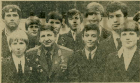
После вручения училищу знамени от отряда космонавтов. Среди ребят — летчик-космонавт СССР, Герой Советского Союза Ю. И. Глазков.