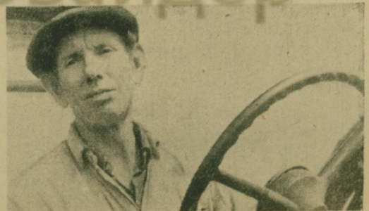
Механизаторы ОПХ «Коренево» готовят к жатве хлеб: обслуживают уборочные комбайны, охотятся от сорняков старых участков.

Налаживание хорошей ритмичности производства — дело работников многих служб. Особенно велика роль снабженческих организаций. Не меньшая ответственность возлагается на руководителей цехов, участков, мастеров производства, ремонтников. Плотно, с пользой для дела необходимо трудиться с первыми днями месяца. Хорошая ритмичность — залог успешного выполнения плана и обязательств коллективов предприятий.