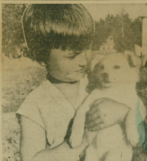
Неразлучные друзья.

встретили композицию на темы русских народных песен. Вел программу конференсье Владимир Александров. Вместе с этим ансамблем выступил югославский артист Никола Златович. Люберчанам очень понравились песни «Танец на барабане», прозвучавшая в его исполнении. После концерта в Люберецком Дворце культуры ансамбль «Шестеро молодых» выезжает к строителям БАМа. Н. ПОДПЛЕТА.