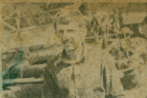
НА 29 ИЮЛЯ В РАЙОНЕ ХЛЕБ УБРАН С ПЛОЩАДИ 705 ГЕКТАРОВ, ЧТО СОСТАВЛЯЕТ 62,1 ПРОЦЕНТА К ПЛАНУ, НАМОЛОЧЕНО 1242 ТОННЫ ЗЕРНА.

Групповой метод работы хлеборобов Ипатьевского района Сталинского края уже не первый год практикуется на полях нашего района. Он помогает важным сельскохозяйственным кампаниям проводить в сжатые сроки и с хорошим качеством.