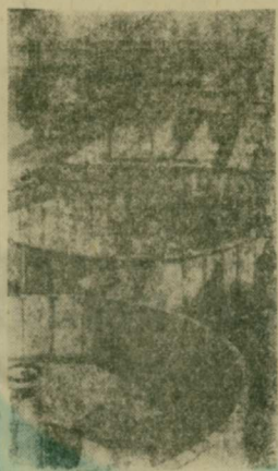
«Обеспечить дальнейшее развитие Саянского территориально-производственного комплекса».

(Из «Основных направлений экономического и социального развития СССР на 1981—1985 годы и на период до 1990 года».)