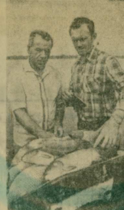
БЕЛГОРОДСКАЯ ОБЛАСТЬ. Голубые нивы рыбокомбината «Октябрьский» дают ежегодно по тысяче и более тонн живой рыбы.