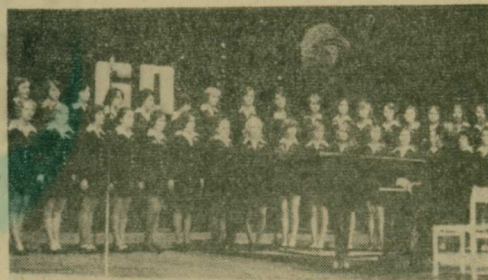
В училище создан хор, который выступает перед учащимися с интересными концертами.

Учащиеся в своих мастерских (см. снимок) под руководством опытных специалистов успешно овладевают избранными профессиями и выполняют при этом заказы завода. Некоторые детали к выпускаемому заводом им. Ухтомского сельхозмашинам изготавливаются исключительно воспитанниками училища. Мастерская и воспитанниками училища изготовлена и внедрена поточная линия на сварочном участке, в результате производительность труда здесь возросла в 2 раза.