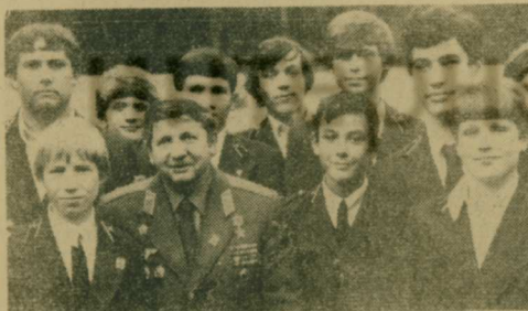
После вручения училищу знамени от отряда космонавтов. Среди ребят — летчик-космонавт СССР, Герой Советского Союза Ю. Н. Глазков.