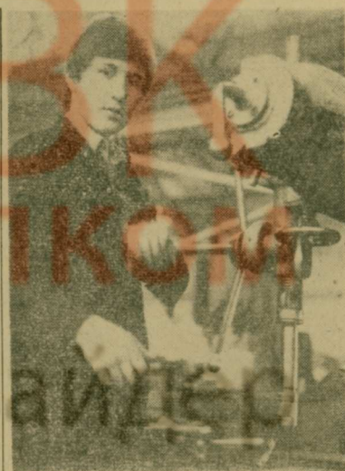
Мастерские училища, расположенные на территории базового предприятия — завода имени Ухтомского, оснащены современным оборудованием. Здесь есть токарный участок на 30 мест, слесарный — на 60 мест, фрезерное отделение, электромонтажная лаборатория. Неудивительно поэтому, что учащиеся в период прохождения производственной практики со знанием дела трудятся и на таких станках, как радиально-сверлильный (см. снимок).

Для получения профессии и среднего образования в училище созданы все условия. В этом году базовое предприятие — завод им. Ухтомского — подарит училищу к 1 сентября новую пристройку, где разместятся хорошо оборудованные лаборатории, учебные кабинеты, спортивные зал, тир, столовая. Добро пожаловать в наше училище, дорогие ребята!