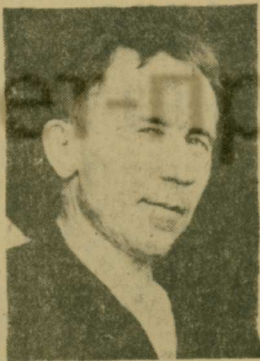
Активисты народного контроля сделали фотографии, которые имели свое воздействие на нерадивых работников.

Мы практичнее проведение рейдов по проверке отношения к материальным, топливно-энергетическим ресурсам. К примеру, вскрыли недостатки в складировании электроизоляторов, при котором допускался бой их. Сделаны замечания по хранению инструментальной стали, цветного металла. Некоторые склады при проверке находились в захламленном со-