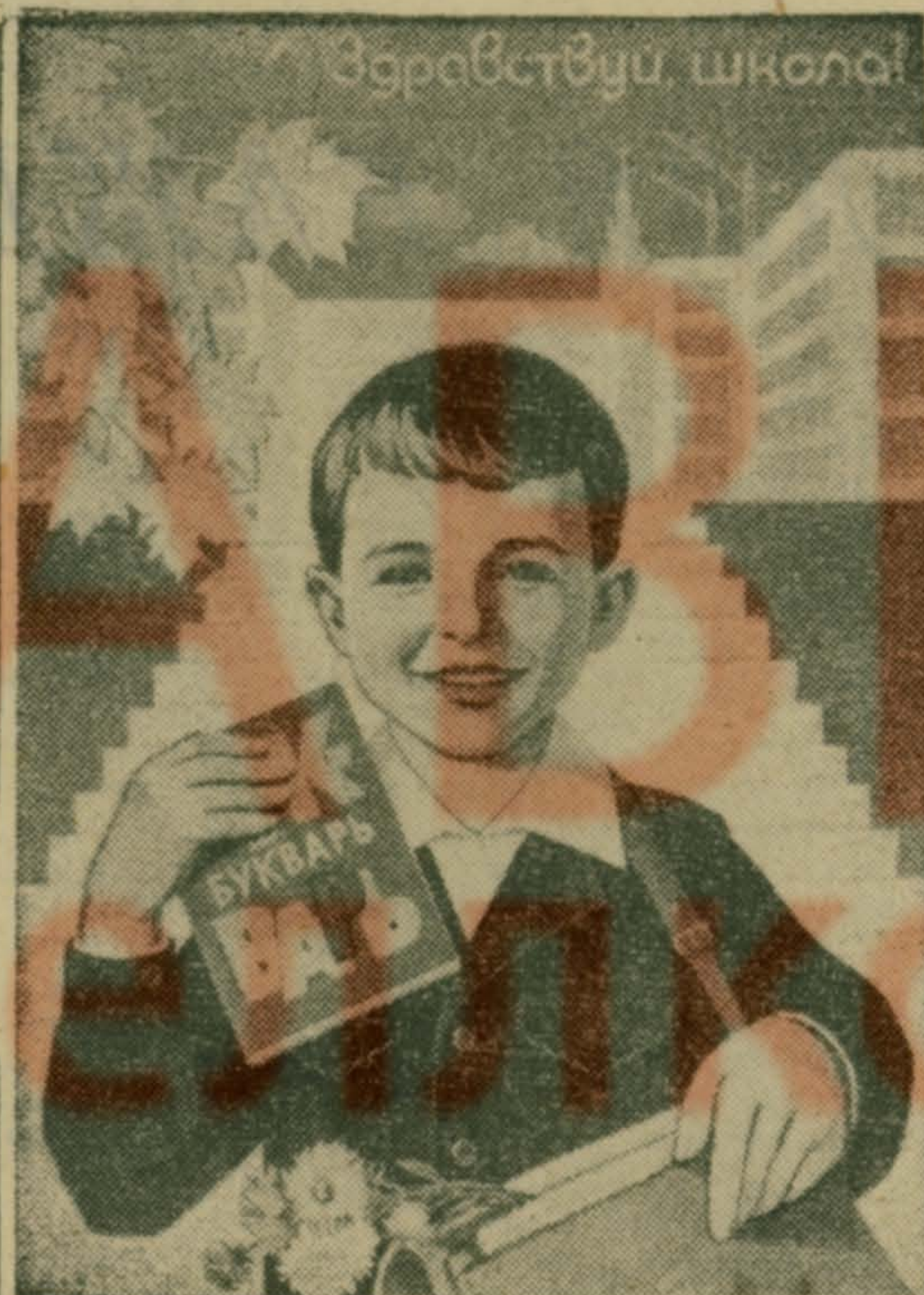
Плакат художника В. Конохова. Издательство «Плакат».

Т. КАПИЧНИКОВА, художественный руководитель Люберецкого ПКЮ.