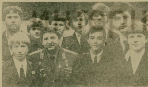
После вручения училищу знамени от отряда космонавтов. Среди ребят — летчик-космонавт СССР, Герой Советского Союза Ю. Н. Глазков.

Мастерские училища, расположенные на территории базового предприятия — завода имени Ухтомского, оснащены современным оборудованием. Здесь есть токарный участок на 30 мест, слесарный — на 60 мест, фрезерное отделение, электромонтажная лаборатория. Неудивительно поэтому, что учащиеся в период прохождения производственной практики со знанием дела трудятся и на таких станках, как радиально-сверлильный (см. снимок).