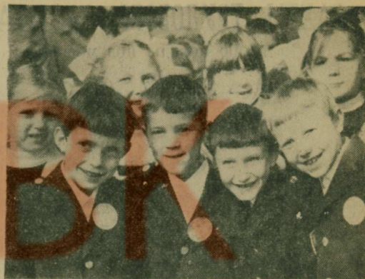
Сотни первоклассников в нынешнем году переступили пороги люберецких школ. Начало путешествия в страну знаний совпадает у них с подготовкой к празднику «Красная звездочка», который проводится накануне 64-й годовщины Великой Октябрьской социалистической революции. Сейчас ребята учат правила октябрю, знакомятся с подвигами юных героев.