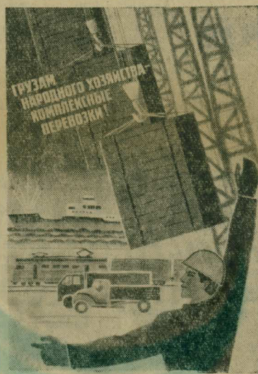
Плакат художника Е. Вертоградова. Издательство «Плакат».

дительной работы. В ней раскрываются формы и методы деятельности культурно-просветительных учреждений по идеологическому обеспечению выполнения народнохозяйственных планов, повышению трудовой и политической активности трудящихся, формированию всесторонне развитой личности, активной жизненной позиции.