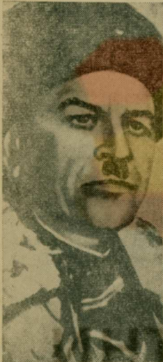
КАЗАХСКАЯ ССР. В грозные годы Великой Отечественной войны, в великой битве под Москвой особое упорство, мужество и героизм проявили воины легендарной 316-й стрелковой дивизии под командованием генерал-майора И. В. Панфилова.

Дивизия была сформирована в июле 1941 года в Алма-Ате. Уже с первых боев войны