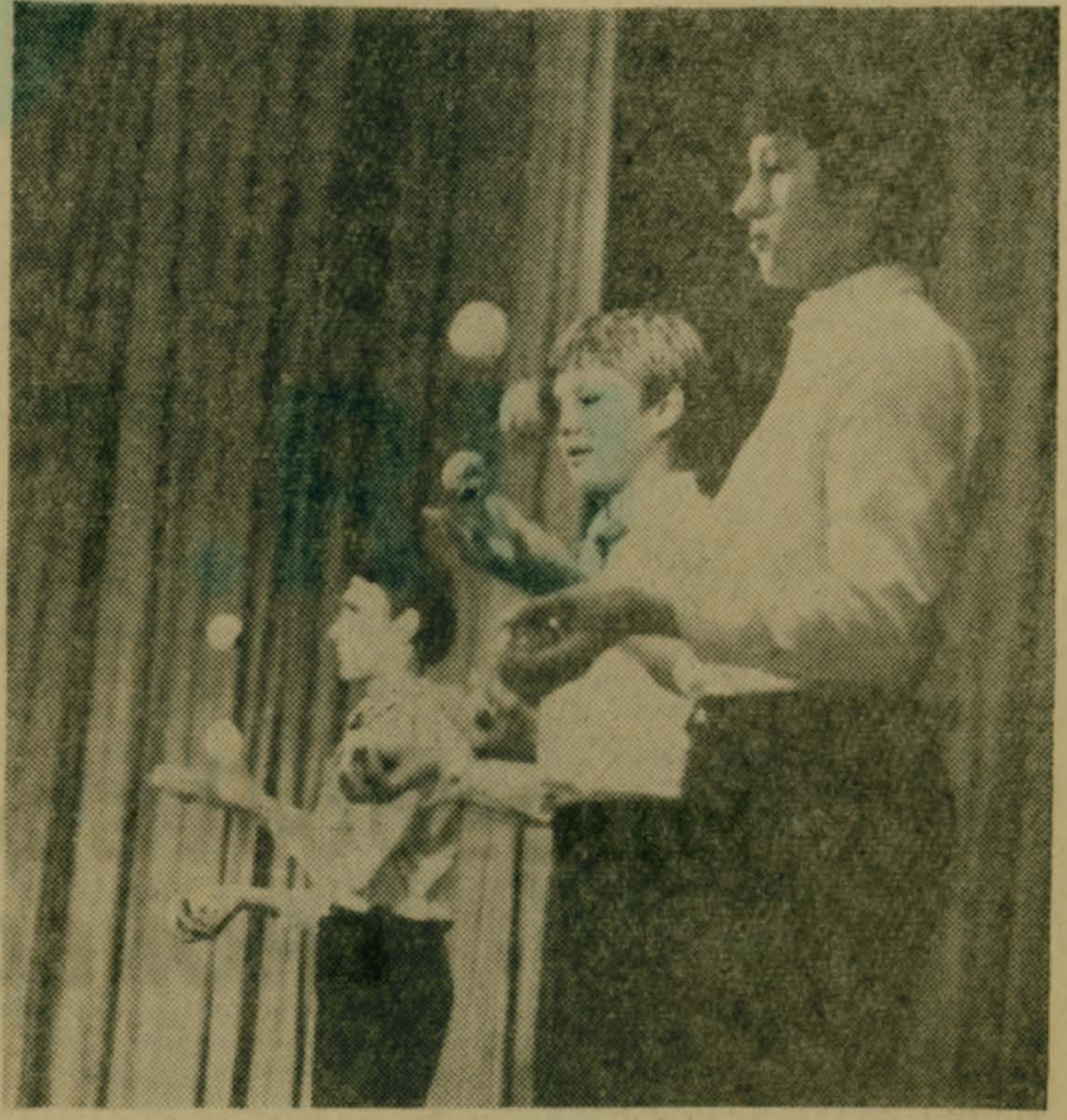
Редактор П. В. СПИРОВ.

ПО ГОРИЗОНТАЛИ: 4. Азимут. 7. Алголь. 9. Рубин. 10. «Норма». 11. Алмаз. 12. Таран. 13. Буклет. 15. Арапат. 17. Аванс. 20. Брест. 21. «Битла». 23. Просо. 26. Аптека. 28. Патрон. 29. Трест. 30. Кашпо. 31. Игрек. 33. Котик. 34. Гривна. 35. Абсурд. ПО ВЕРТИКАЛИ: 1. Азия. 2. Кабар-га. 3. Блюз. 5. Морелос. 6. Тратта. 7. Ананас. 8. Гамма. 14. Укроп. 16. Аалто. 18. Вар. 19. «Нос». 22. Ингерес. 23. Патока. 24. «Орестей». 25. Оптикс. 27. Ершов. 30. «Корд». 32. Каре.