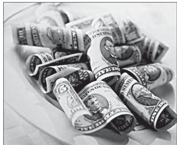
Подготовил Виктор ЧУРИЛОВ