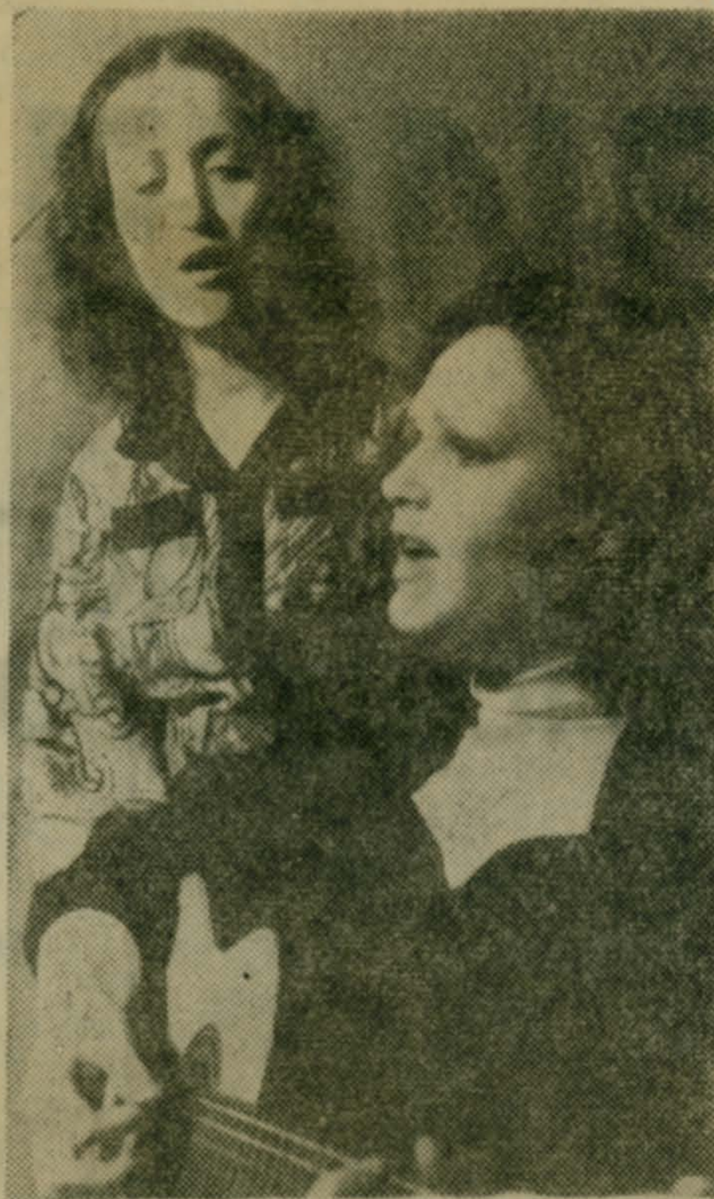
Участников художественной самодеятельности Лыткаринского Дворца культуры «Мир» часто можно встретить в гостях у труженников промышленных и сельскохозяйственных предприятий. Особое внимание уделяется сейчас обслуживанию животноводов. Состоялись выступления на Константиновской птицефабрике, Токаревском комплексе госплемзавода «Петровское». Ожидаются такие концерты в подшефном сельском клубе «Березка». 25 февраля самодеятельные артисты выступят перед рабочими лыткаринских предприятий с программой, которая так и будет называться «В рабочий полдень».

Т. КАПИЧНИКОВА, художественный руководитель Люберецкого парка.