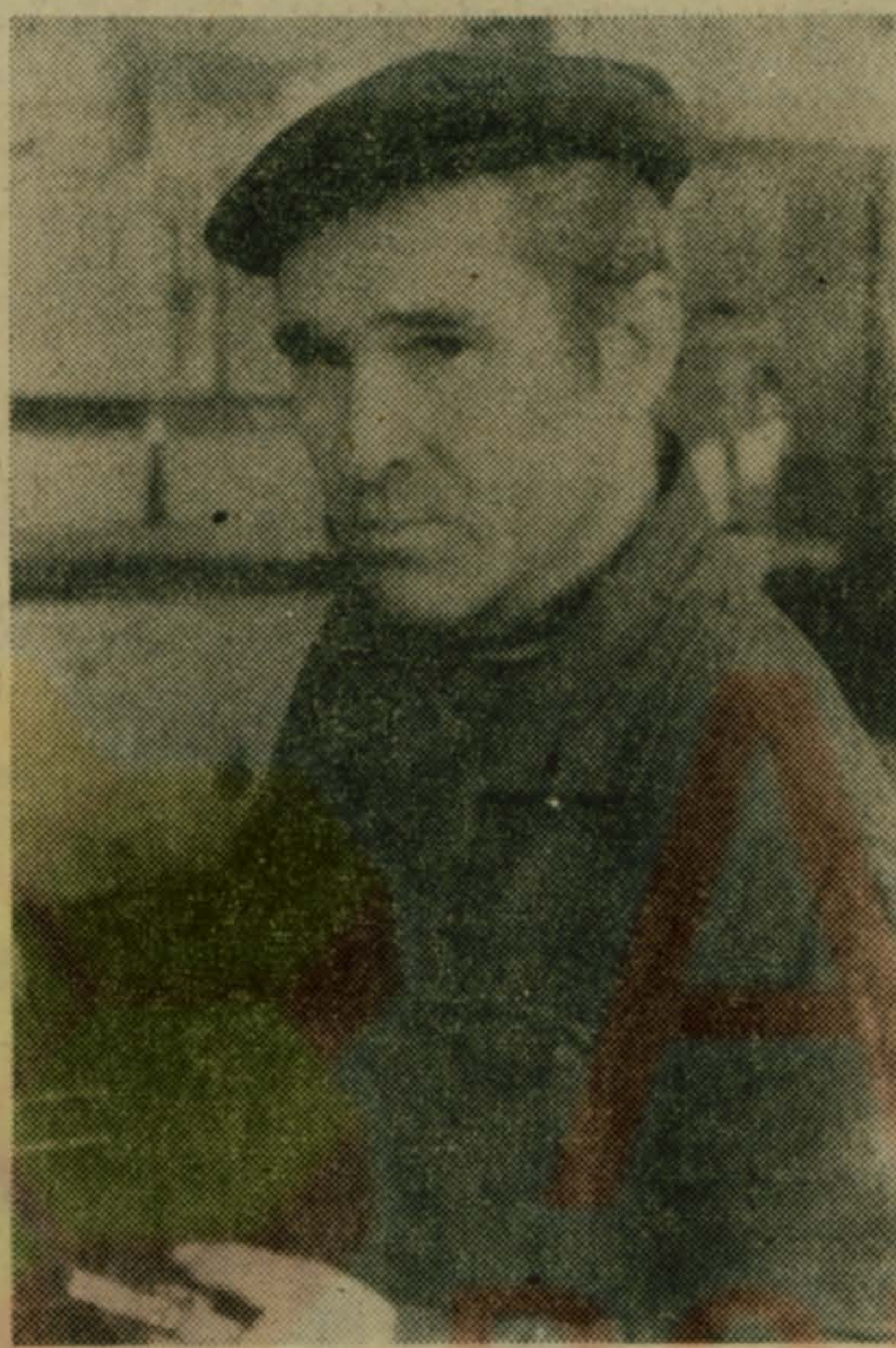
СТРОИКАМ — ТЕМПЫ И КАЧЕСТВО