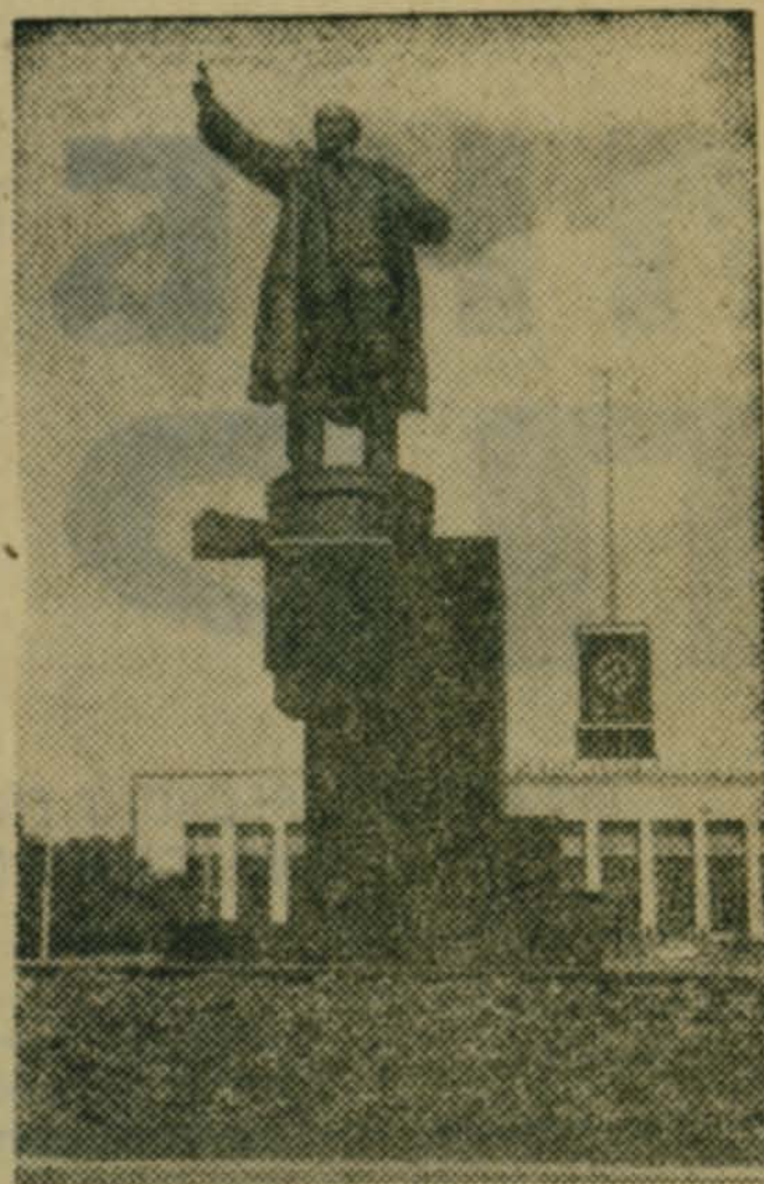
Ленинград. Памятник В. И. ЛЕНИНУ у Финляндского вокзала.