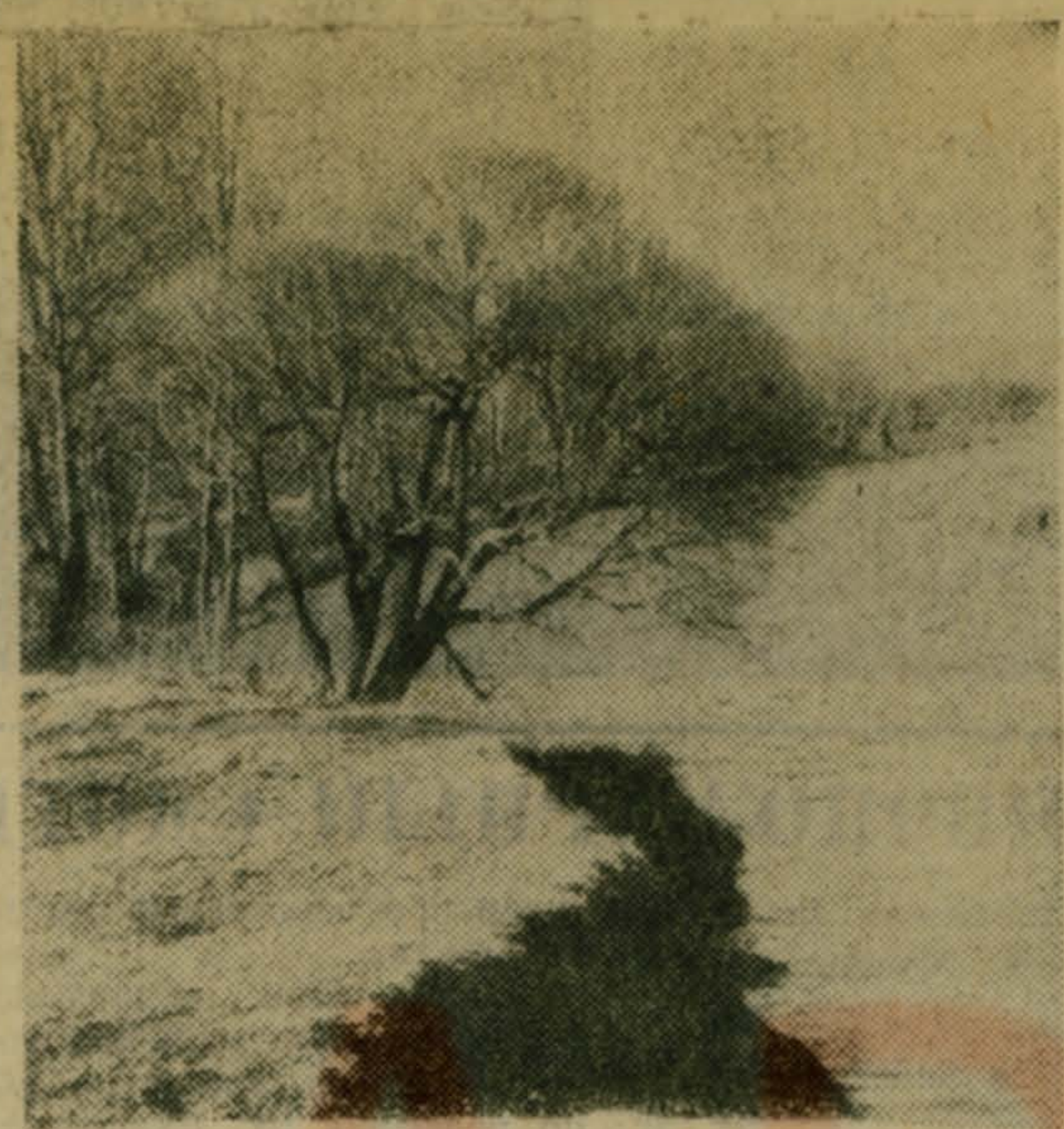
На Пехорке тишь и гладь, Нарядилась ива. Ивушка над кручей, Где природу берегут, Ей, пушистой, не бывать Там всегда красиво. Грустной и плакучей. Стихи В. ЧУЛКОВА. На весеннем берегу