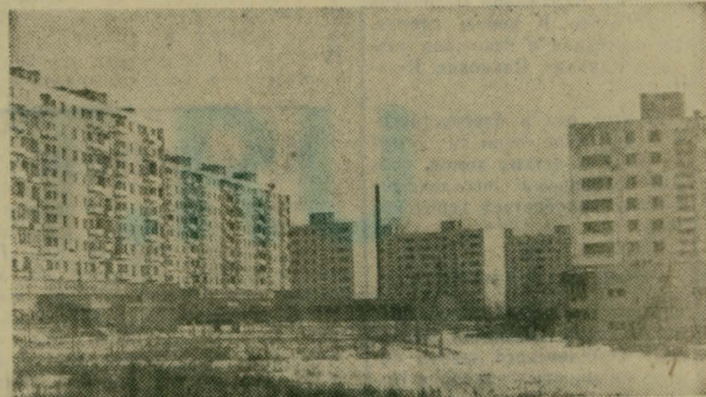
С каждым годом пополняется жилой фонд нашего района. Улучшаются жилищные условия трудящихся. Только в минувшем году населением района получено 165 тысяч квадратных метров новой жилой площади.

НА СНИМКЕ: так выглядит один из уголков 115-го квартала города Люберцы.