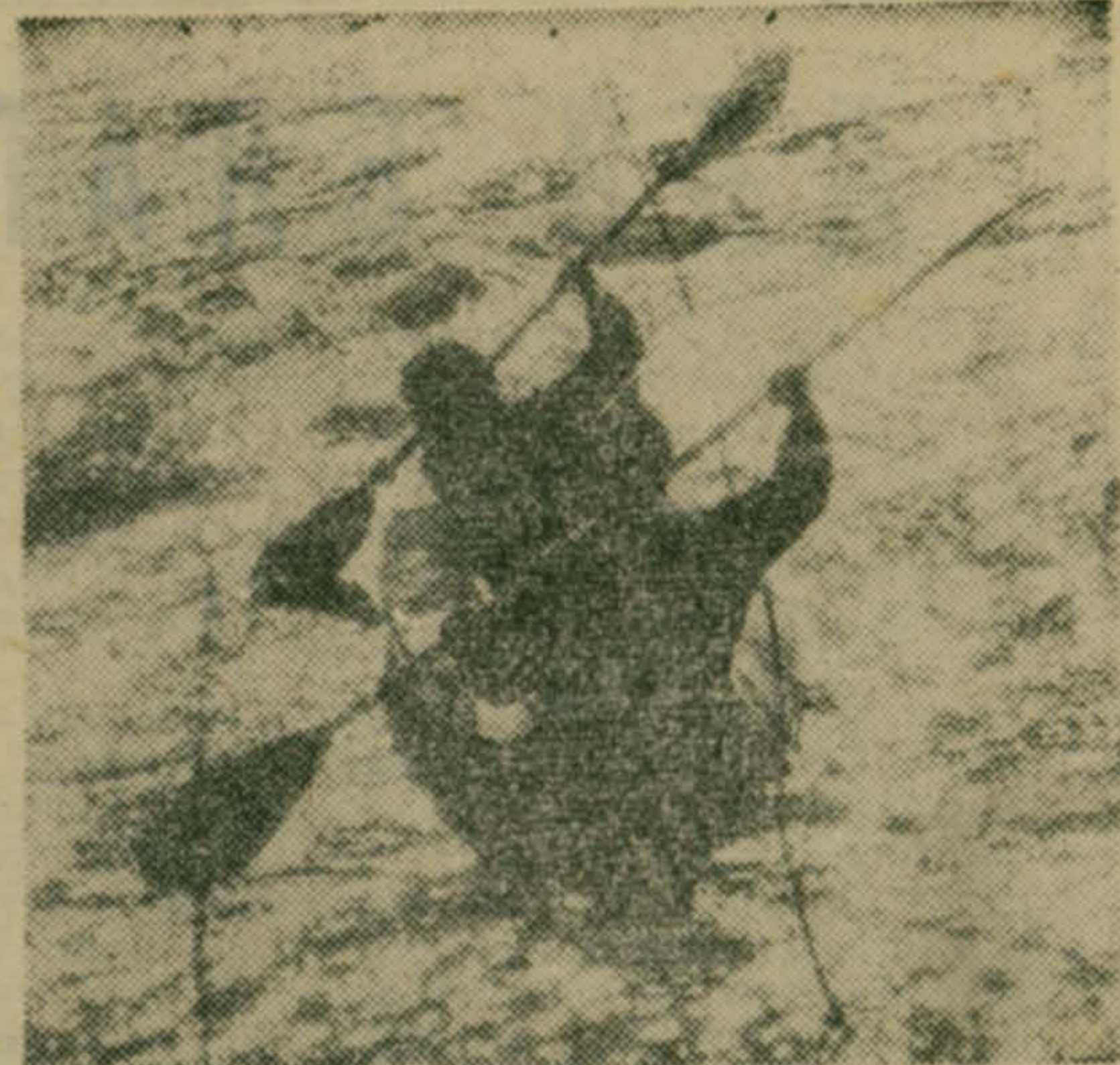
С приходом весны сотни люберецян — любителей походов и экскурсий устремляются на природу, в лес, на реку. Можно увидеть спортсменов-любителей и на реке Пехорке, протекающей между поселками Томилино и Красково. Побойтесь с быстрой водой на байдарках в выходные дни сюда приезжают работники институтов горного дела и горно-химического сырья, другие любители водного спорта.

Л. ЛЕЩИНСКИЙ, инструктор ГК КПСС, ответственный секретарь правления районного отделения Общества.