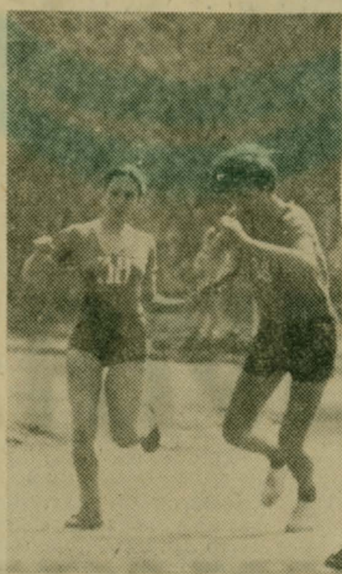
Момент передачи эстафеты.