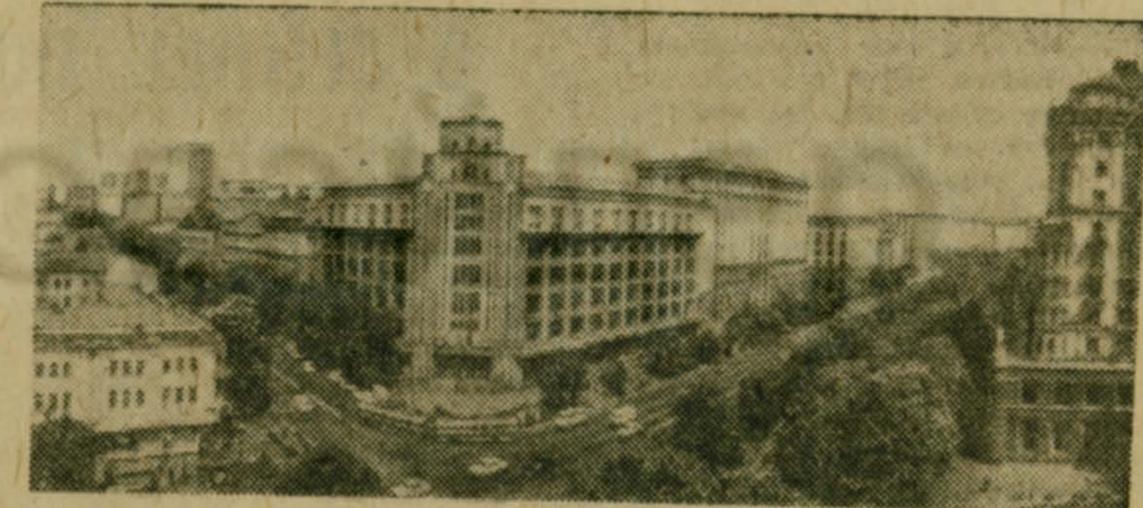
НА СНИМКЕ: Крещатик — главный проспект Киева.

Если взглянуть на карту, то Киев лежит как бы на основном стволе дерева — Днепре, ветви которого составляют реки Припять, Десна, Сейм, Сож и т. д. Все они впадают в Днепр выше Киева. В бассейне этих рек жили десятки славянских племен. И когда во времена великого переселения они двинулись вниз, на юг, путь их лежал мимо Киева.