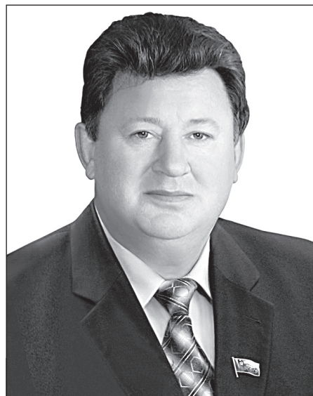
Владимир Иванович КАШИН, заместитель председателя ЦК КПРФ, лауреат Государственной премии РФ, академик РАСХН, лидер списка КПРФ по Московской области на выборах депутатов Государственной Думы

В соответствии со статьей 71 Конституции РФ в ведении государства находится формирование ценовой политики. На основании этого положения Президент и Правительство РФ должны контролировать уровень цен на товары и продовольствие. У нас же государство бросило на произвол судьбы отечественного товаропроизводителя и потребителя и уходит в сторону от ответственности за ситуацию.