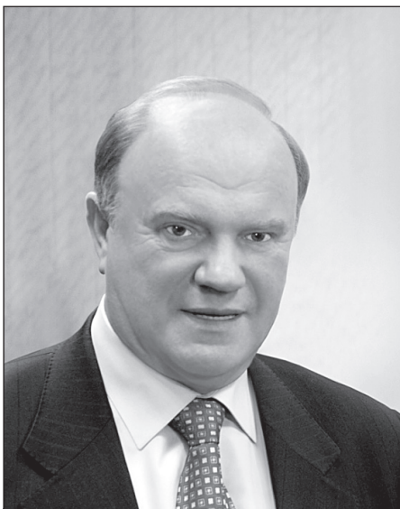
Геннадий Андреевич ЗЮГАНОВ, председатель ЦК КПРФ, лидер списка КПРФ на выборах депутатов Государственной Думы

3. Социологи утверждают: многие из Вас терпеть не могут власть бюрократов, в особенности Правительство и думское большинство. Немалый процент слушателей радиостанции «Эхо Москвы» при опросе заявили, что «Единая Россия» выражает