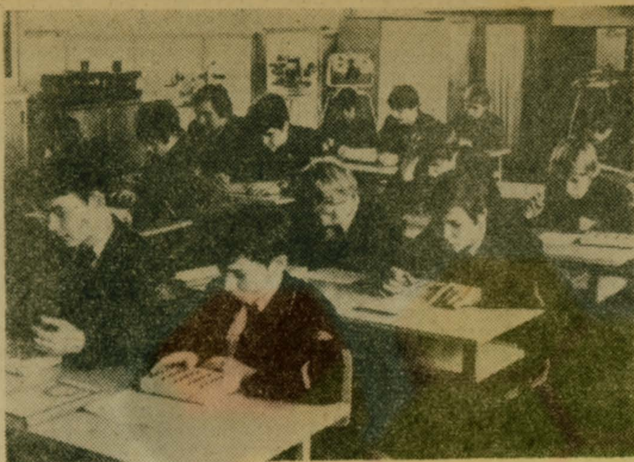
На уроке спецтехнологии слесарей-инструментальщиков

Такой подарок базового завода даст возможность еще лучше организовать учебно-производственную и культурно-воспитательную работу в училище.