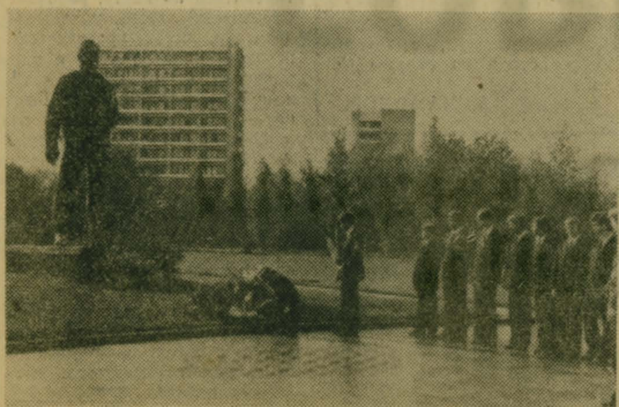
Юные гагаринцы в Звездном