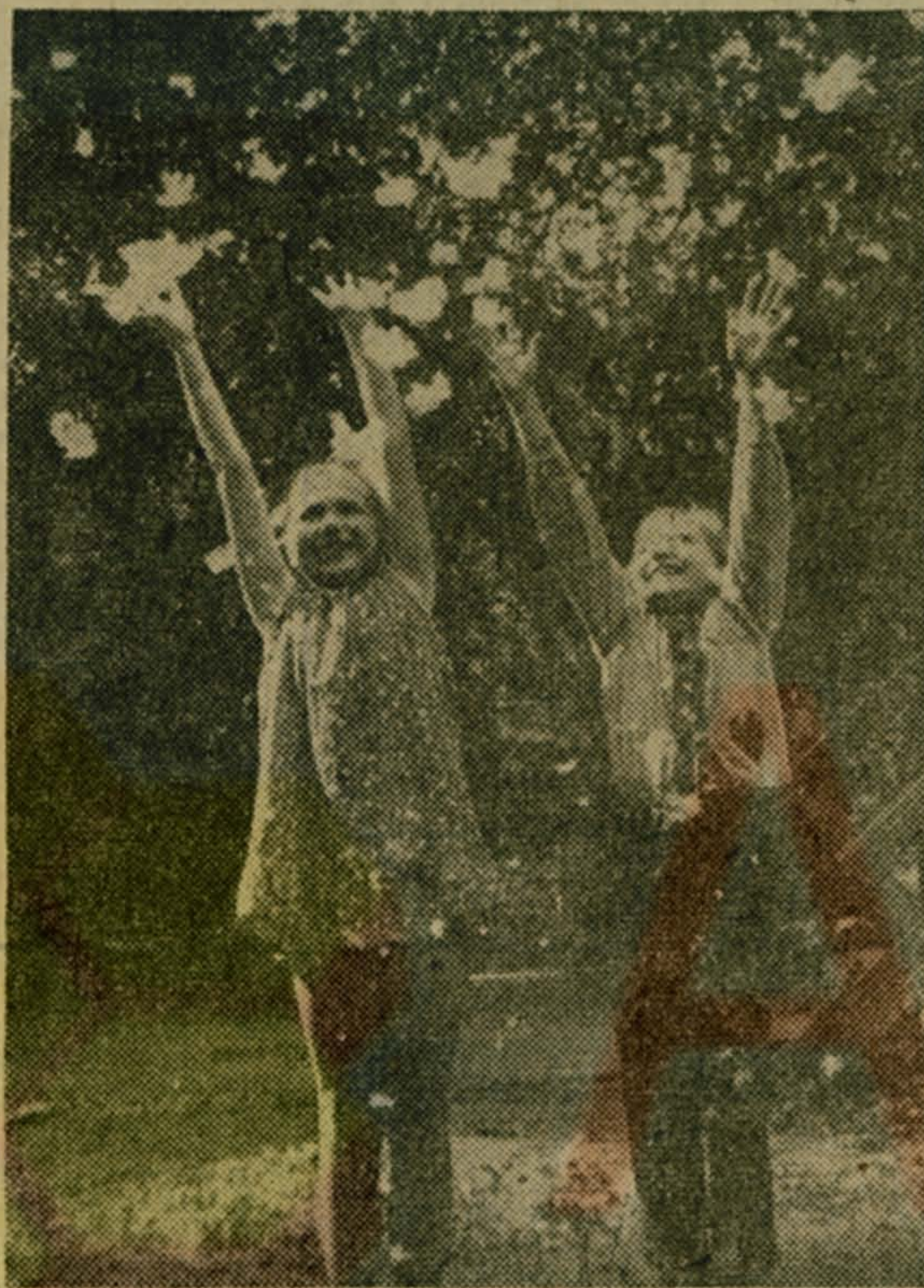
Хорошо, когда солнце яркое и небо синее...