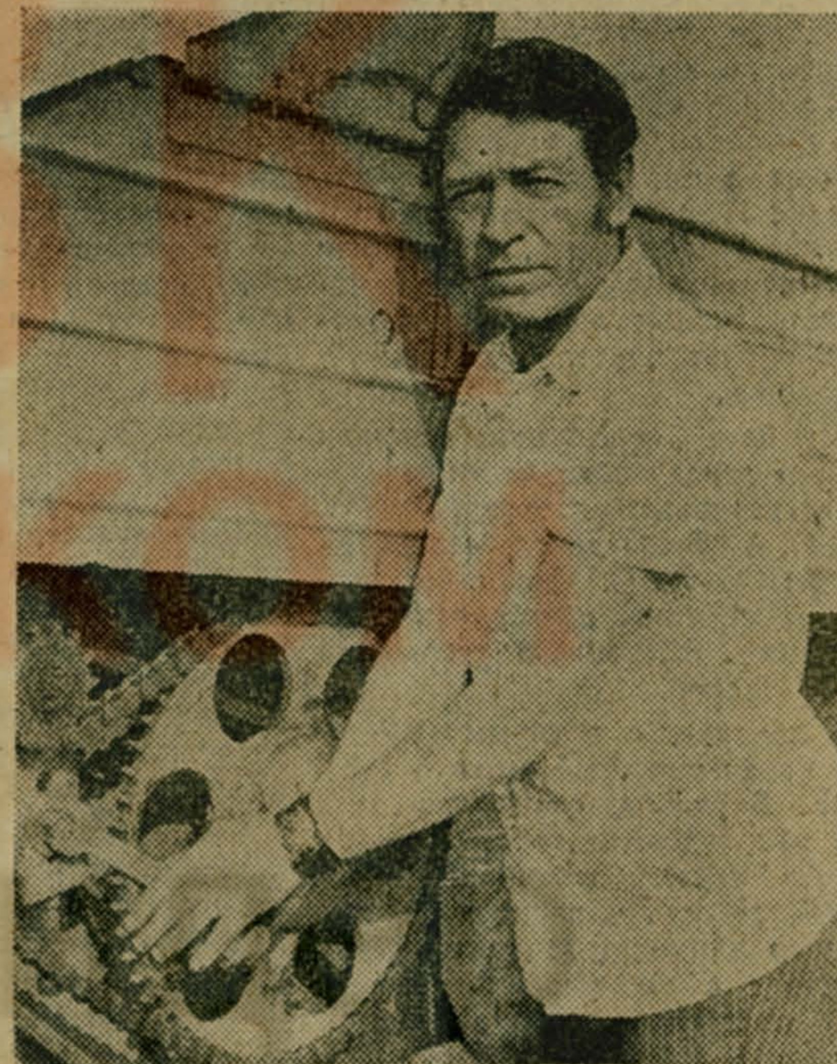
Погожие без дождей дни ускорили темпы заготовки кормов в совхозе им. Моссовета. План закладки сенажа уже выполнен. Теперь все внимание коллектива уборочного комплекса сосредоточено на заготовке сена.

Н. ГРИБАНОВА, инструктор исполкома Люберецкого горсовета.