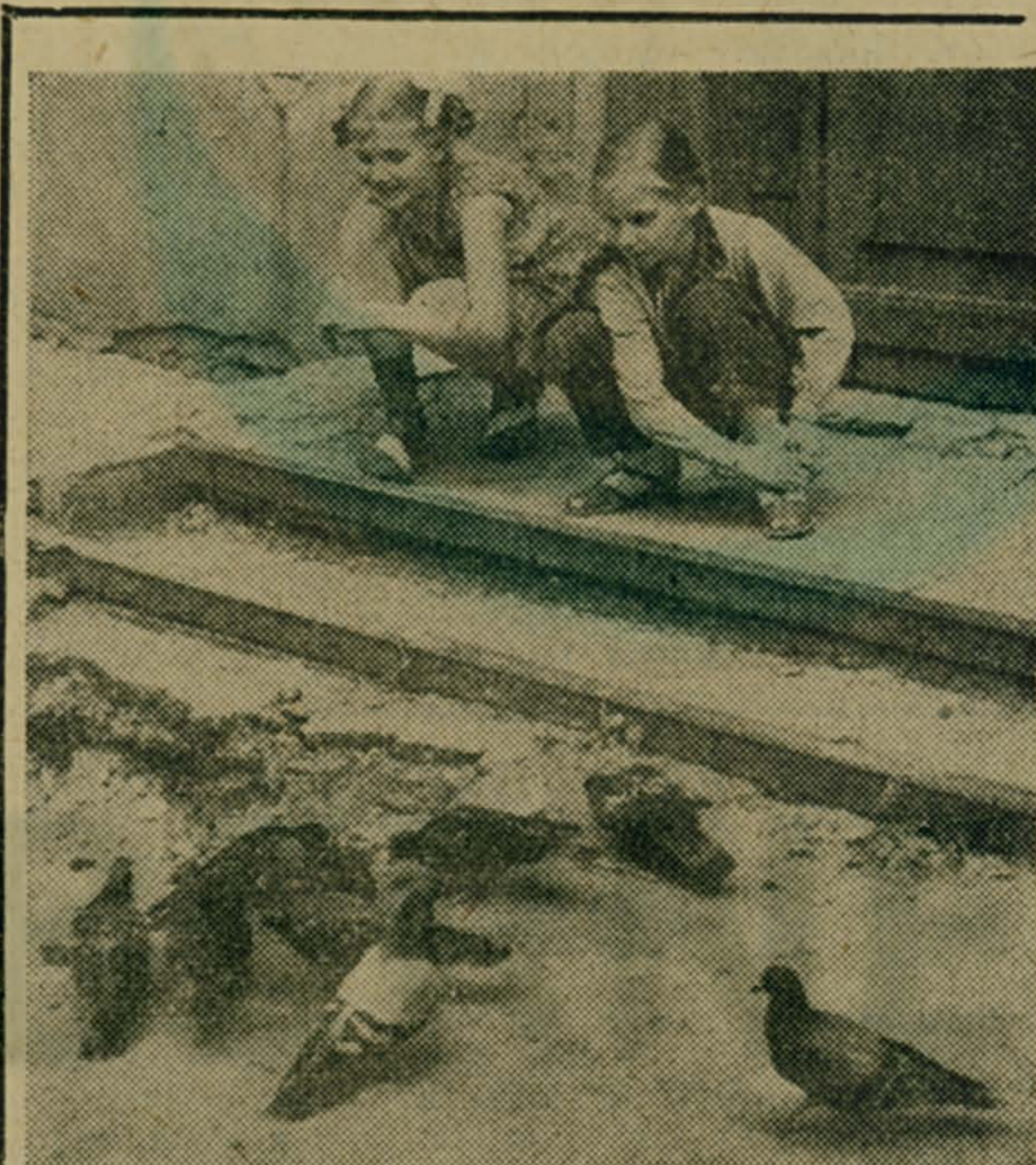
Дружно собрались пернатые друзья на завтрак.

директор Люберецкой детско-юношеской спортивной школы по тяжелой атлетике.