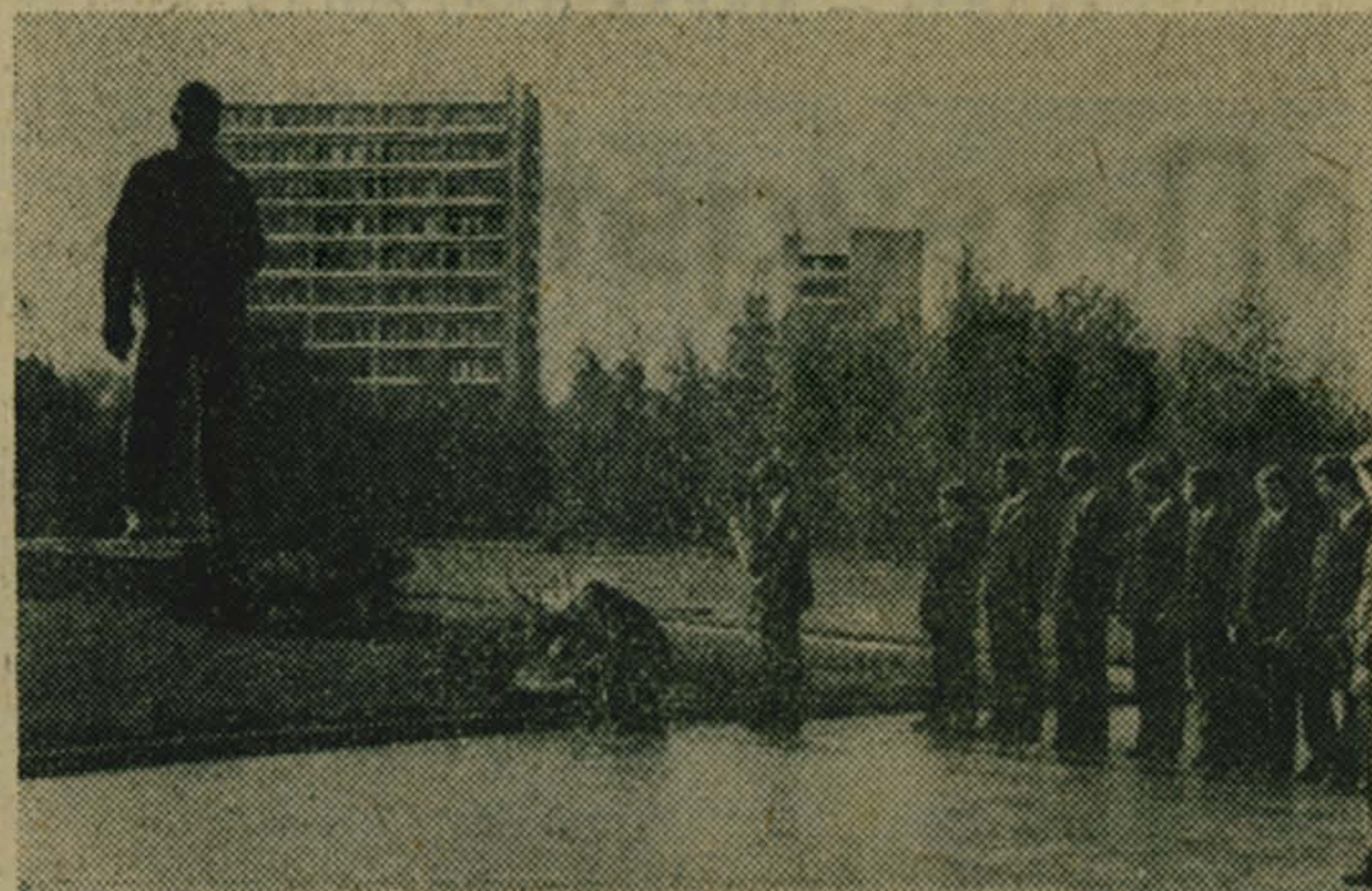
Юные гагаринцы в Звездном