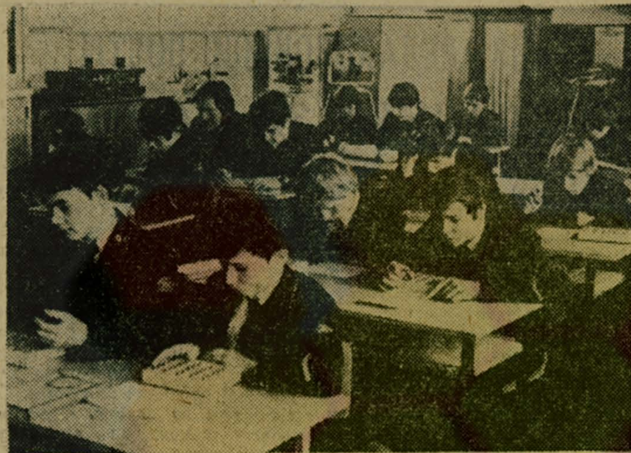
На уроке спецтехнологии слесарей-инструментальщиков

Такой подарок базового завода даст возможность еще лучше организовать учебно-производственную и культурно-воспитательную работу в училище.