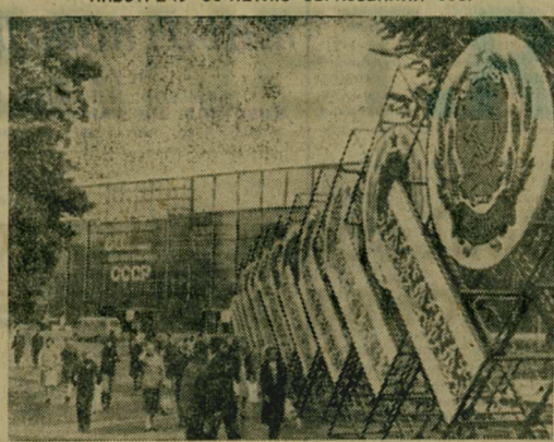
МОСКВА. На ВДНХ СССР открылась экспозиция «В семье единой», отражающая достижения Советских Социалистических республик за годы Советской власти.