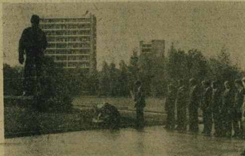
Юные гагаринцы в Звездном

Адрес училища: г. Люберцы, Октябрьский проспект, 136, телефон 552-34-91 (дирекция).