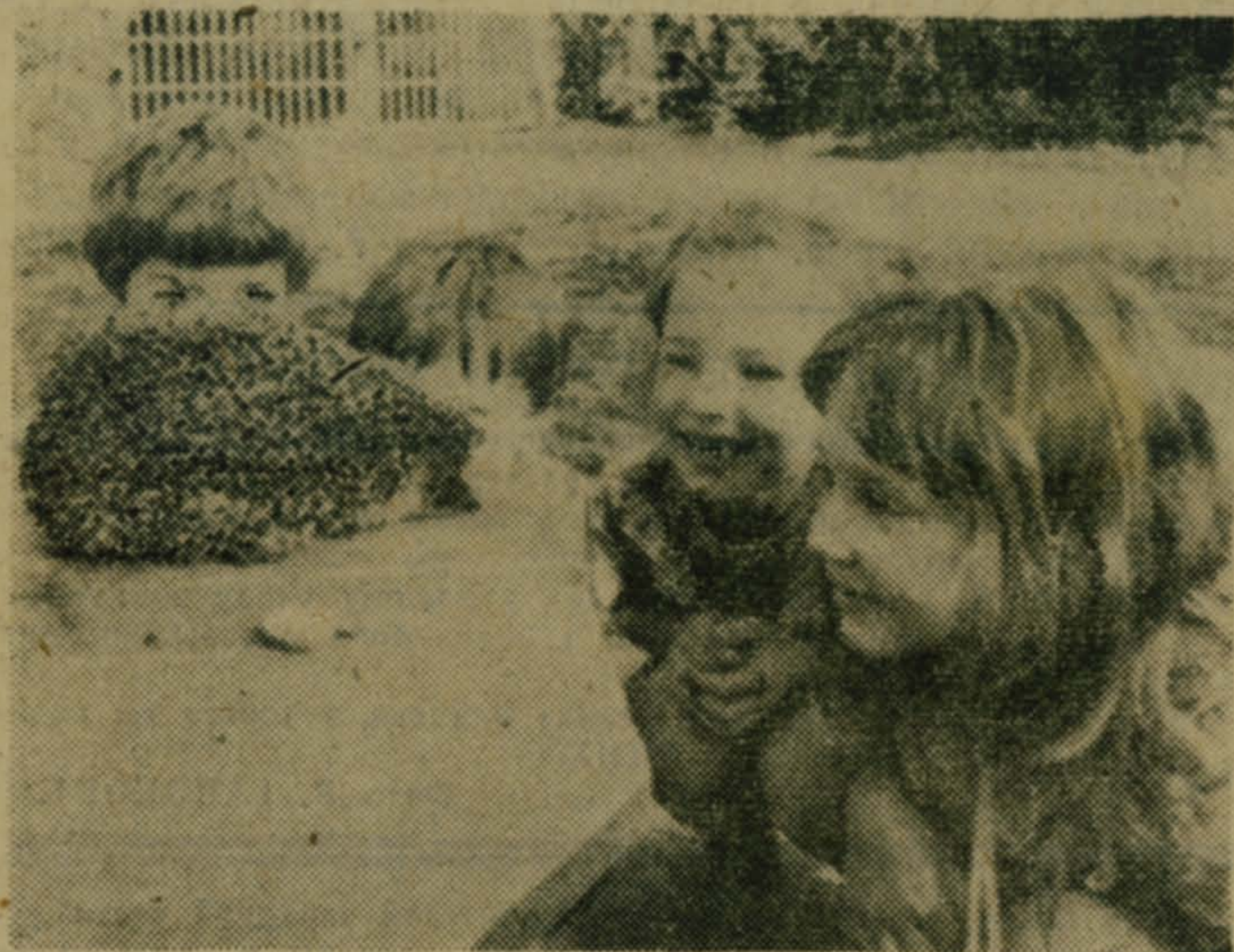
Ежик — пришелец из леса, конечно, удивлен новой обстановкой: кто они, эти люди? А это юные друзья. Им радостно, им интересно видеть и общаться с таким коллечим — таким добрым ежиком.  Зам. редактора П. С. БИЦУКОВ.

В. КАЙДАШ, старший инспектор профессиональной подготовки Люберецкого УВД.