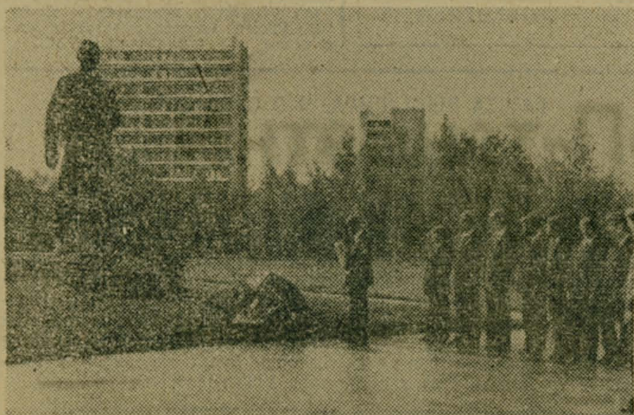
Юные гагаринцы в Звездном