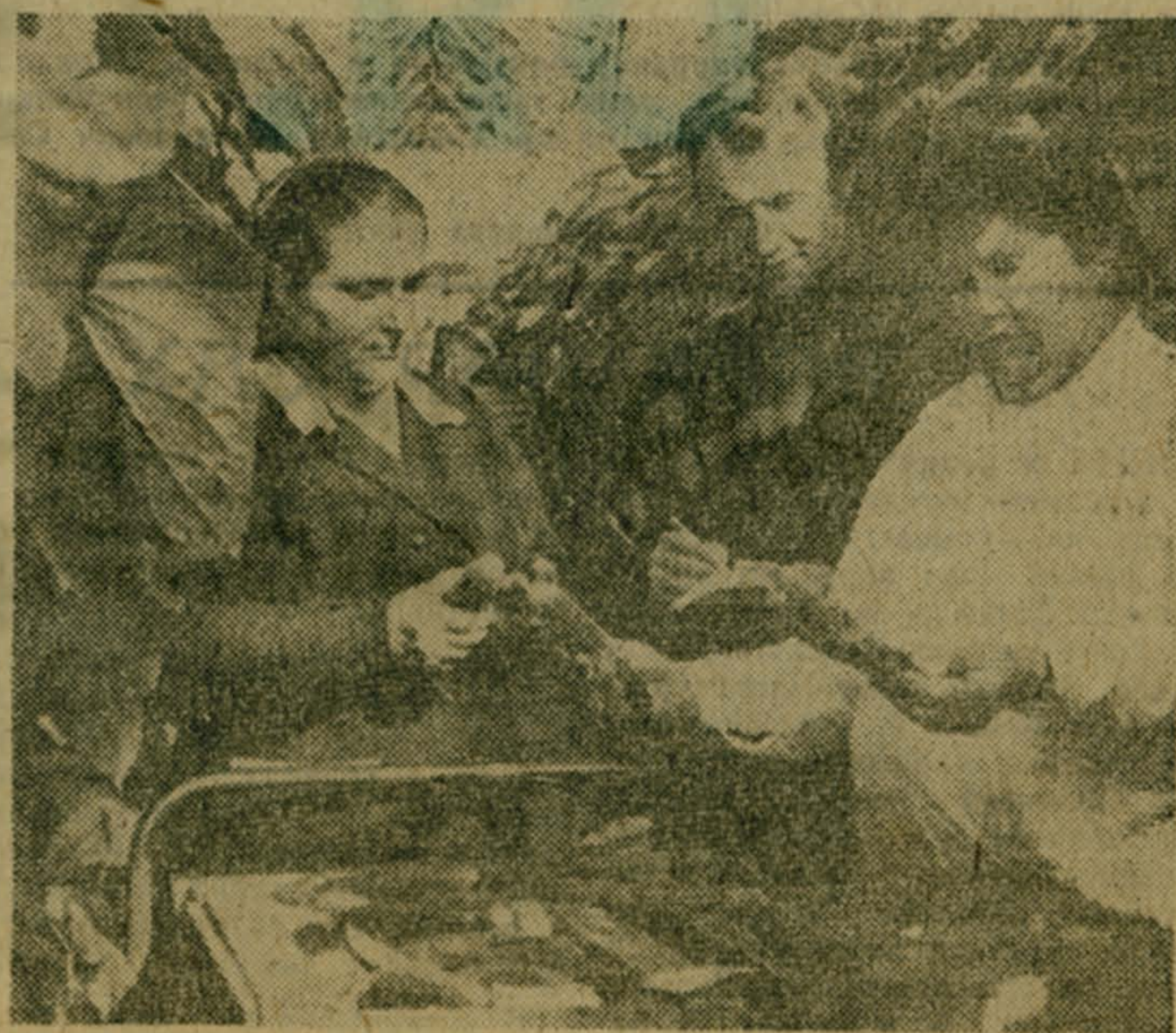
Большое внимание уделяют народные контролеры совхоза им. Горького проверке качества овощей, отправляемых в реализацию. В результате постоянного контроля 99 процентов собранных в теплицах огурцов и 98 процентов помидоров — продукция стандартная.