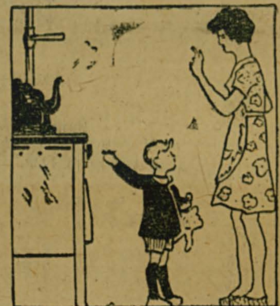
Не разрешайте детям и лицам, не знающим правил обращения с газовыми приборами, включать газ.