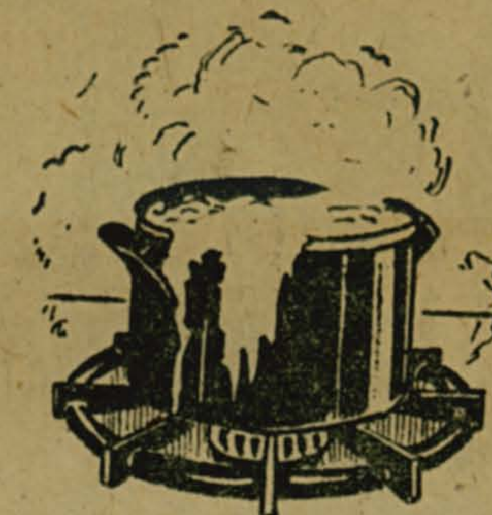
Не оставляйте газовые горелки без присмотра.

До и после включения газовой колонки проверьте тягу в дымоходе.