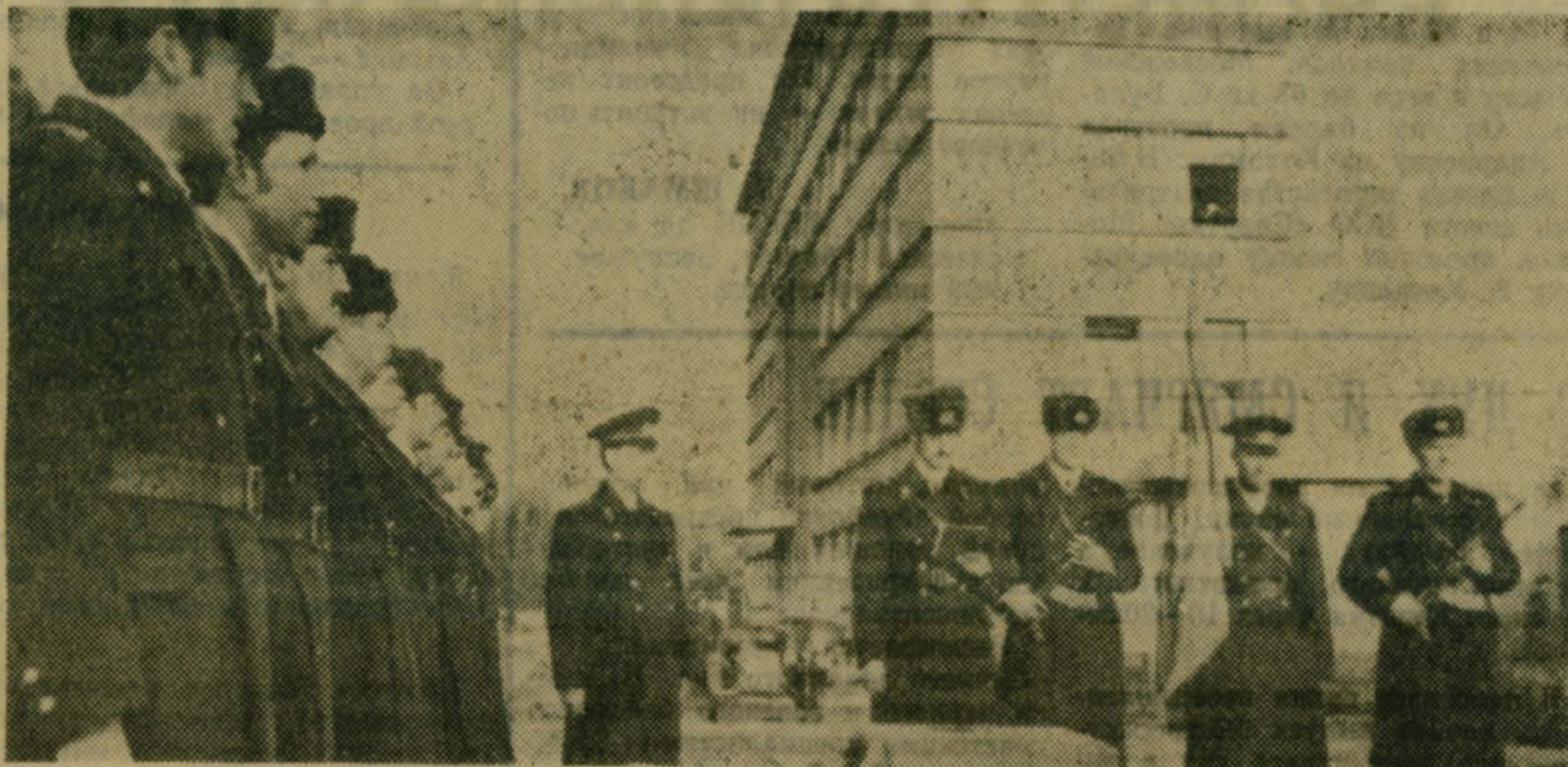
НА СНИМКЕ: молодые сотрудники Люберецкого УВД принимают Присягу.