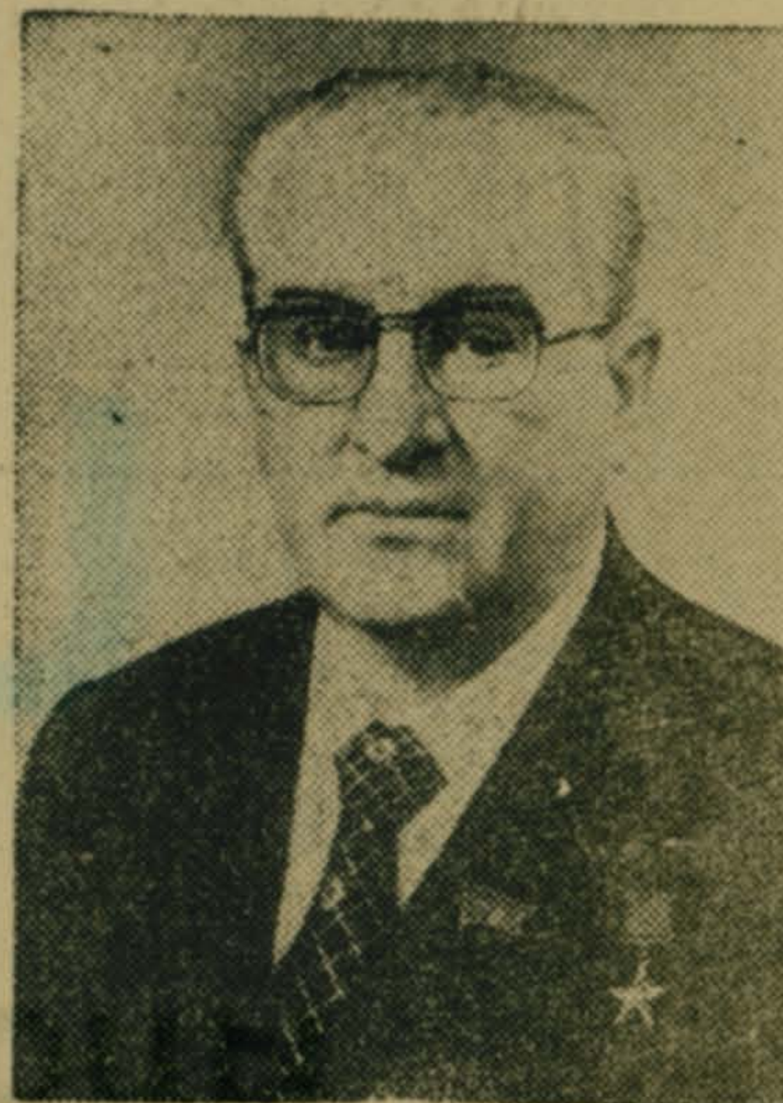
Генеральный секретарь Центрального Комитета Коммунистической партии Советского Союза Юрий Владимирович АНДРОПОВ