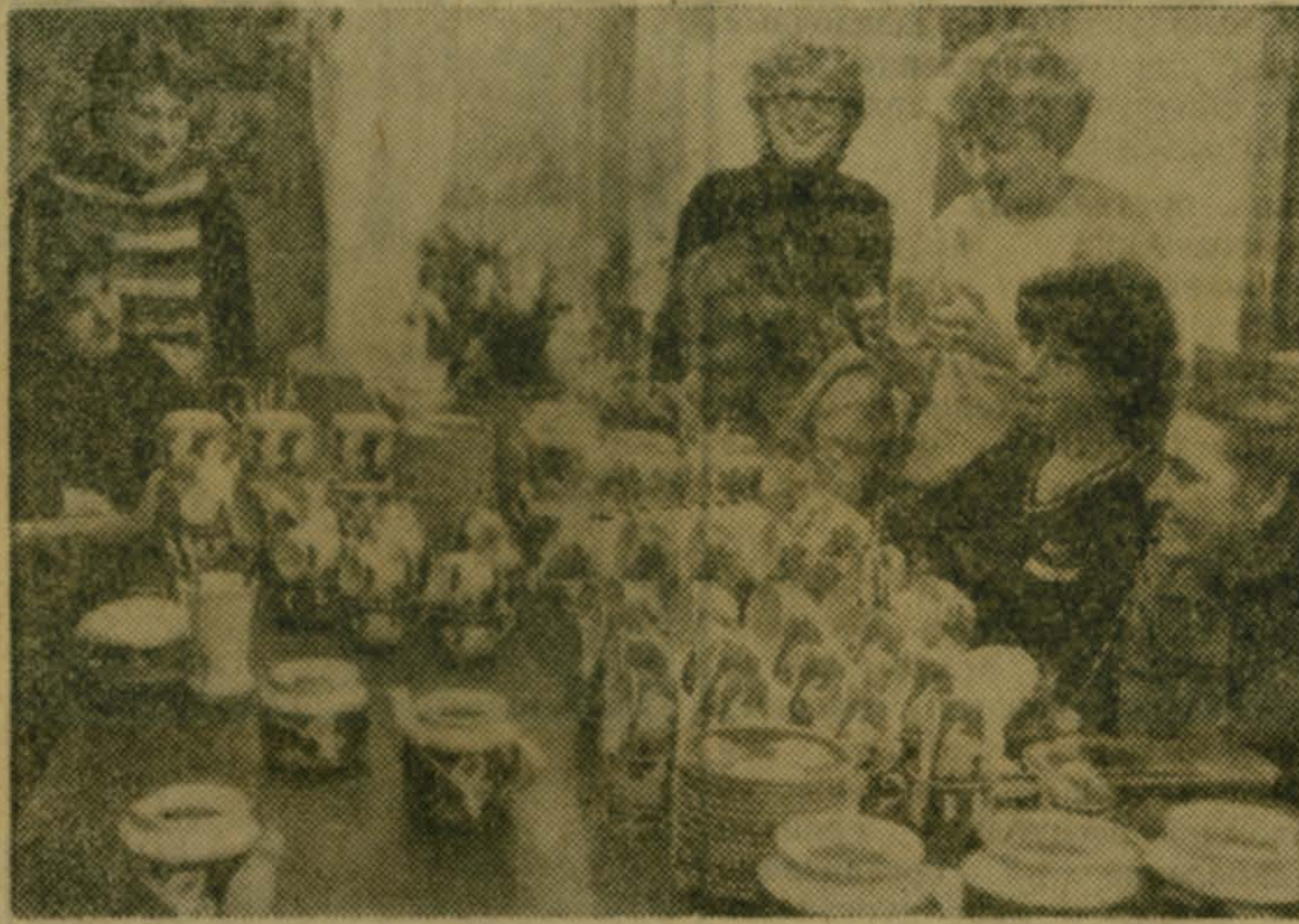
МОСКОВСКАЯ ОБЛАСТЬ. Успешно завершает программу юбилейного года Дмитровский ордена Трудового Красного Знамени фарфоровый завод. 44 миллиона изделий выпустил завод за год.

Более 130 передовиков производства обязались к дню 60-летия образования СССР завершить личные задания двух с половиной лет. 95 процентов продукции здесь изготавливается на механизированных и автоматизированных линиях.